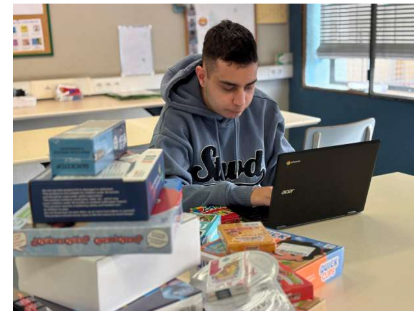
Fent inventari dels jocs nous per la Biblioteca

Els jocs de taula en adults són fonamentals per estimular funcions cognitives com la memòria, estratègia o l'atenció. També ens ajuda a reduir l'estrès i fomentar la socialització, millorant l'autoestima i l'estat d'ànim. A més ens ajuden a mantenir el cervell actiu, prevenint el deteriorament cognitiu i reforçant vincles socials en un context d'oci.