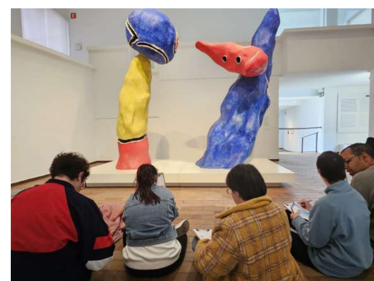
En ple procés creatiu

Visitem la Fundació Joan Miro per fer un taller de dibuix: Dibuixar per pensar. Un taller on dibuixem l'edifici de la Fundació a partir d'unes pautes molt senzilles. Observem i creem, per compartir després el resultat amb les companyes i construir una obra conjunta. L'Art ens permet expressar-nos i gaudim del moment i gaudir del moment present.