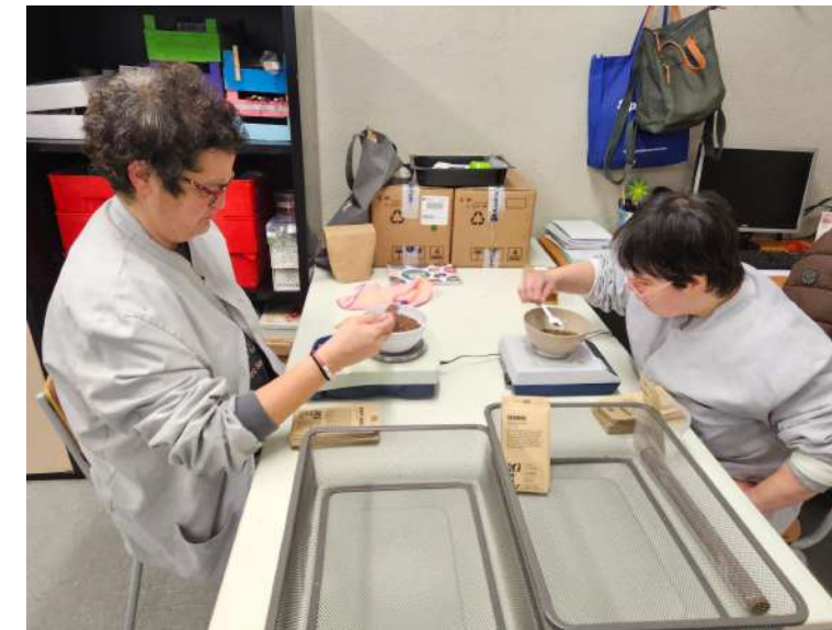
Una nova feina que requereix vista, paciència i precisió

Iniciem una nova col·laboració amb la cooperativa les Refardes. Ens encarreguen preparar diferents sobres amb llavors de plantes ecològiques. Per fer-ho contem amb dues bàscules, que ens deixen, ja que cada llavor té un pes concret i específic. Ara mateix estem treballant amb unes deu varietats diferents.