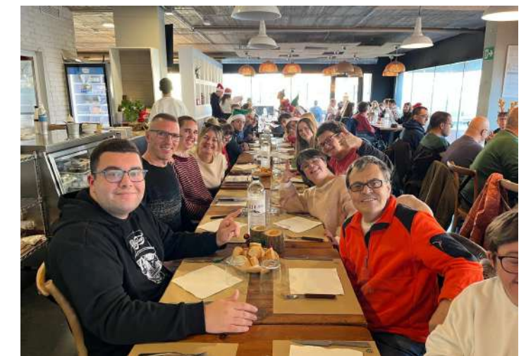
Acabem un dia genial amb un fantastic dinar

Per tercer any participem a la cursa solidaria "La Vuelta al Cole Unoentrecienmil". Anem tota la Fundació: escola i taller, al parc de Can Gambús. Per tal que tothom pugui participar es fan dos recorreguts. Un curt de mig quilòmetre i un llarg de un quilòmetre. Alguns companys tenen el suport d'alumnes de l'escola, fent parella per realitzar el recorregut