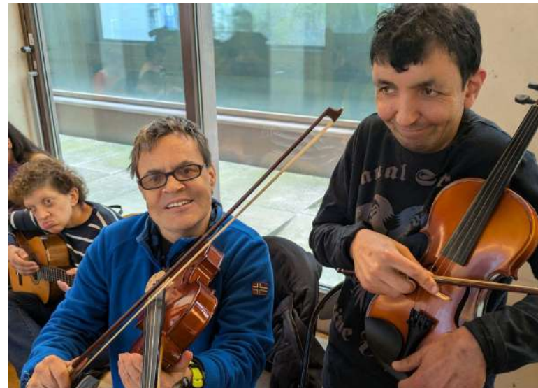
Som músics per un dia

Passem un dia fantàstic amb alguns dels músics de l'Orquestra Simfònica de Barcelona i Nacional de Catalunya (OBC) i la musicoterapeuta Cati Clancy. No només assistim a un assaig sinó que podem experimentar amb els instruments i ens convertim en músics de cambra per dia i tot això a en el mateix auditori, una passada!!