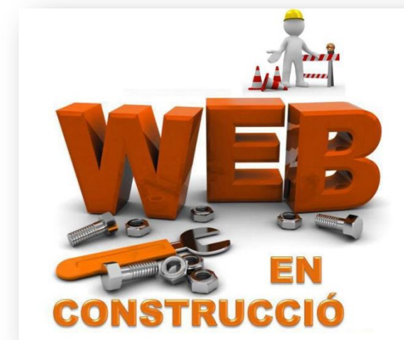
Ja falta poc per veure la Web

La web informa de la nostra història, les persones que formem part, les activitats, serveis, projectes i productes que fem, l'actualitat, i moltes coses més! .....Esperem que us agradi!