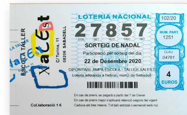
El número guanyador!!

Enguany, per les mesures covid, el pagament s'ha fet pel banc. Portem repartides 1384 participacions i esperem ser un dels agraciats!!!