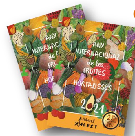
Portada del Calendari Solidari