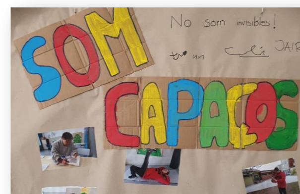
Cartell pel dia de les capacitats

Al taller, cada grup ha fet activitats especials: cinema, jocs, debats, murals per fer visibles les nostres capacitats i els nostres drets.