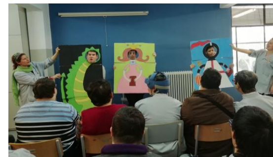
Jocs florals 2019