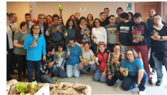
El grup de companys amb els enciams

El 24 de Maig un grup de companys i companyes vam anar a l'hotel de Granollers a fer, amb treballadors de la Fundació Fluidra, un taller de sabons artesanals i un altre d'hort urbà on vam plantar enciams. Vam aprendre molt i ho vam passar genial!!!