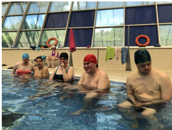
El grup C a la piscina

Dimecres 5 de juny el grup C vam anar a les piscines del Club Natació Sabadell de Can Llong.