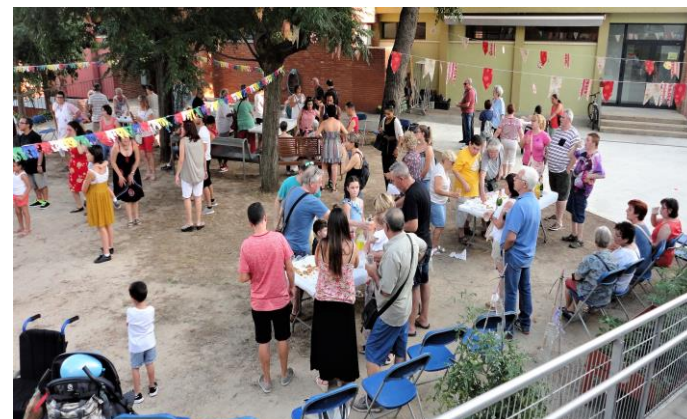
A la festa d'estiu