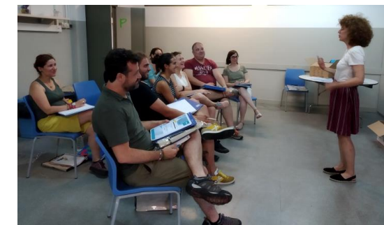
Els professionals a la formació