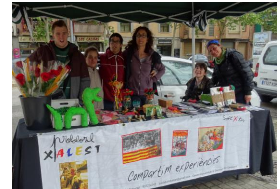
La parada de la carretera Terrassa

Com a novetat hem tingut clauers i pacs de llibretes. Van tenir una gran demanda i èxit.