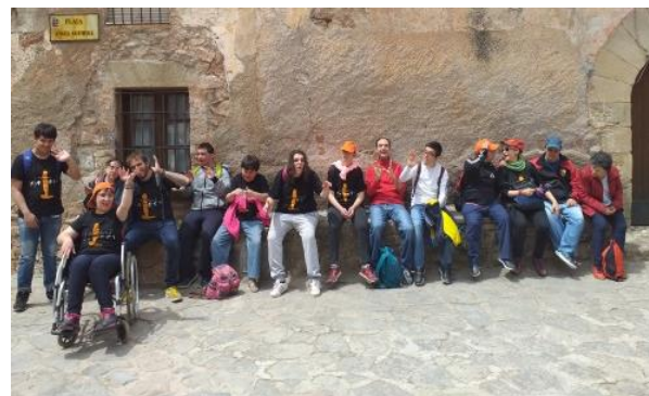
El grup B a Mura