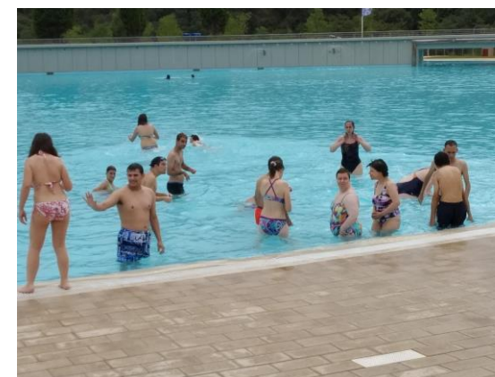
Remullant-nos a la bassa