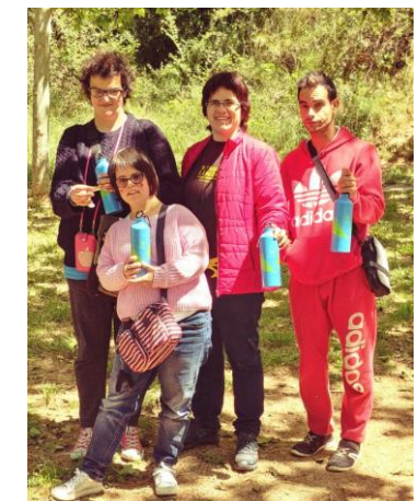
Els voluntaris de Prolaboral Xalest