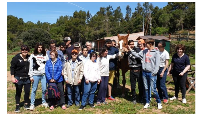
El grup de treball a la granja

Va ser un dia molt divertit i molt xulo!!