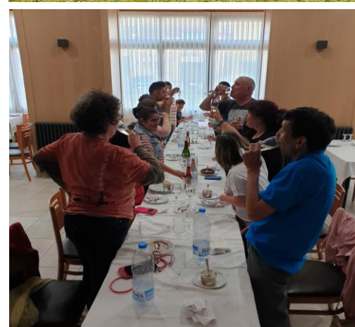
Gaudint a la Vall de Núria