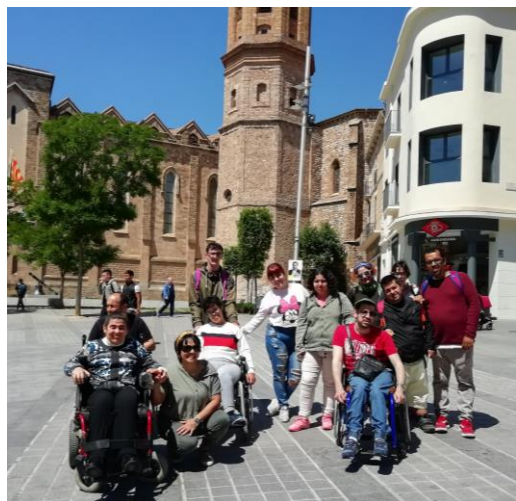
El grup de serveis arribant al Foc Ventura