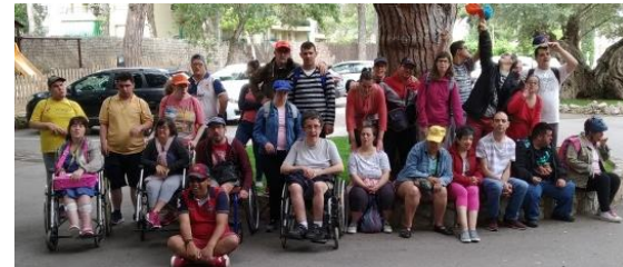
Gaudint a Platja d'Aro