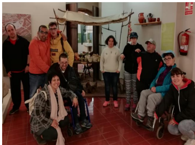
El grup de serveis al museu

El dimecres 20 març el grup de serveis vam anar al museu d'història de Sabadell on vam aprendre molt sobre la ciutat. Abans de la visita vam esmorzar als jardinetes. Una vegada al museu una noia ens va explicar de manera molt dinàmica que el primer nom de Sabadell, va ser Sabadello, que es va trobar en el primer escut referent a Sabadell.