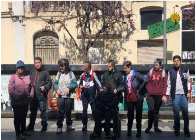
El grup C a l'entrada del cinema

El grup C, el dia 25 de març, vam anar al cinema a veure la pel·lícula; Kerily, la casa dels contes , on la protagonista de la història aprénia a llegir.