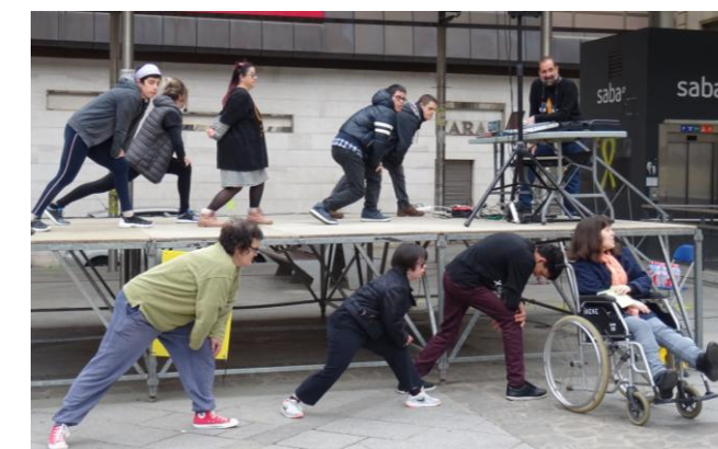
Escalfament del Zumba

També teníem una zona de jocs ambientada en el mar: el tauró "tragaboies", el joc de pesca i un tres en ratlla mariner. I el taller de maquillatge, on ens pintaven a la cara pops, crancs i peixos!! Què maco!!