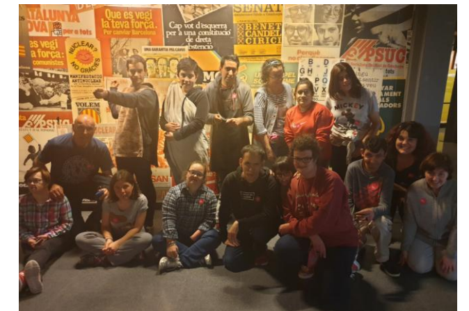
El grup de treball al museu

Per acabar caminem fins al Mc Donald's del Maremàgnum i mengem. Després una passejada per les rambles fins arribar als ferrocarrils catalans! Va ser un dia històric!!