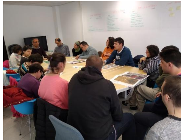
El grup B al diari

Més tard, vam anar a dinar al restaurant xinès Yuan on vam quedar la mar de satisfets.