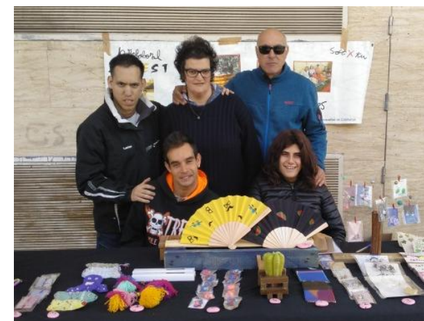
El primer dilluns a la paradeta

El dilluns 18 de març ha tornat a obrir la paradeta a la Plaça del Mercat Central. Tornen els productes estrella: llibretes i ventalls. Com a novetat s'han fet productes amb la temàtica del mar que és el tema de la festa a la Ciutat d'enguany. A més trobareu articles de bijuteria artesanal, clauers, testos i productes de la temporada estival.