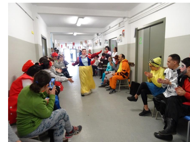
Desfilada de Carnestoltes

Després de la desfilada vam estar ballant fins l'hora de marxar. Ens ho vam passar pipa!!!