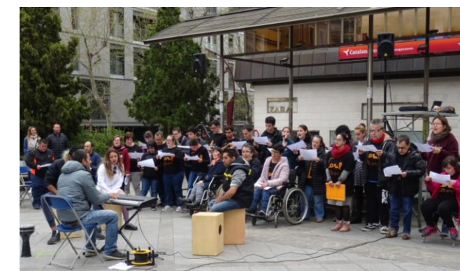
La coral Xalest cantant

També teníem una zona de jocs ambientada en el mar: el tauró "tragaboies", el joc de pesca i un tres en ratlla mariner. I el taller de maquillatge, on ens pintaven a la cara pops, crancs i peixos!! Què maco!!