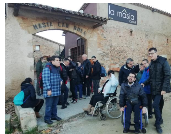
Sortint del restaurant