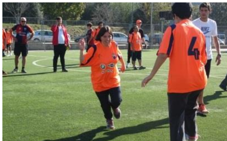
Futbolistes en moviment!

El passat divendres 28 de setembre vam anar al camp de futbol de la Marina d'Arraona Merinals a fer jocs d'habilitat, combats de softcombat, balls de zumba i un partit de futbol, acompanyats per monitors del poliesportiu.