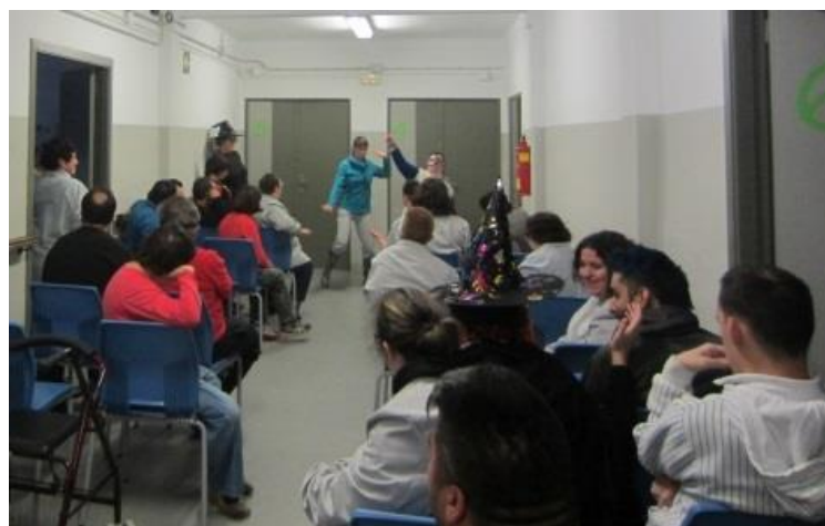
Música, Ball, Moniatos i Castanyes!

Com que plovia ho vam celebrar al passadís, però ens ho vam passar molt bé igualment!