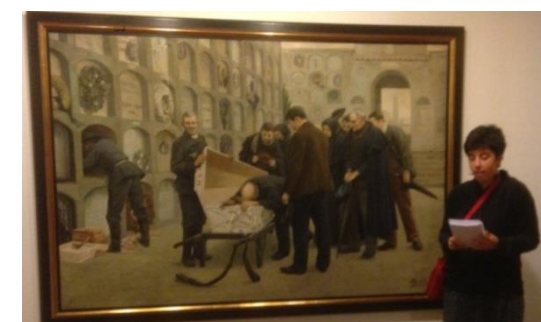
Guies del Museu amb el Regidor