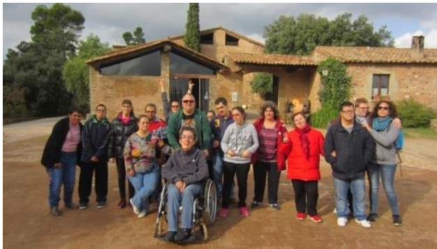
Un dia a l'aire lliure!

El 14 de novembre el Grup A fem la sortida trimestral a la Masia de Can Deu.