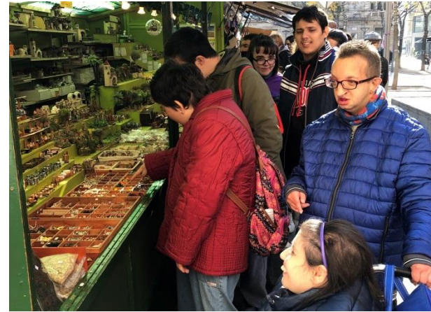
"Les volem totes!"

El 12 de desembre els grups B i C sortim a fer una passejada per la fira de Santa Llúcia de Sabadell.