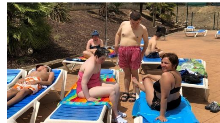
"Al agua patos!"