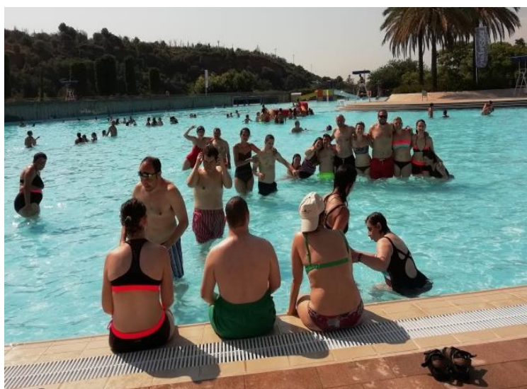
Estem en remull!

El passat dilluns 9 de juliol els companys de tots els grups vam anar a la Bassa de Sant Oleguer.