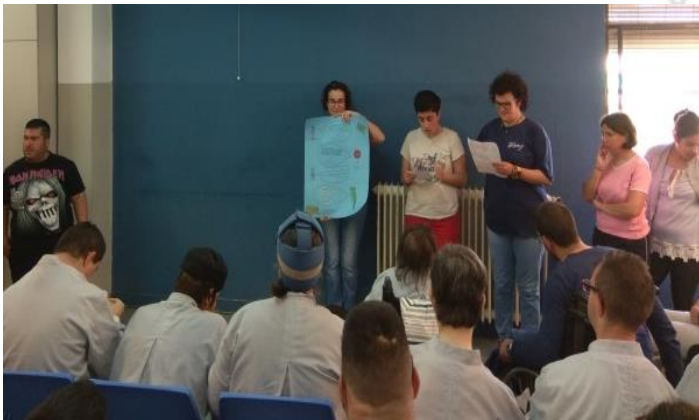
Els companys exposant el seu treball.

El passat dijous 26 d'abril vam celebrar els nostres Jocs Florals. Durant els dies anteriors a cada secció vam parlar del que volia dir Sant Jordi per nosaltres.