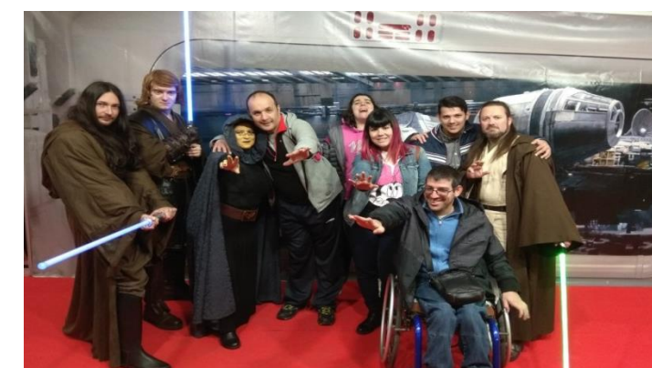
Que la Força ens acompanyi!