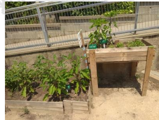
Ens encanta el nostre hort!

Vam començar l'octubre del 2017, preparant una taula per a posar els enciams. Després vam preparar un tros del pati i vam omplir-lo de terra de la bona. Vam plantar i regar amb ampolles d'aigua. També hi vam posar un ninot per espantar els ocells. Ara recollim cebes, tomàquets, enciam, albergínia, raves, mongetes i... maduixes!