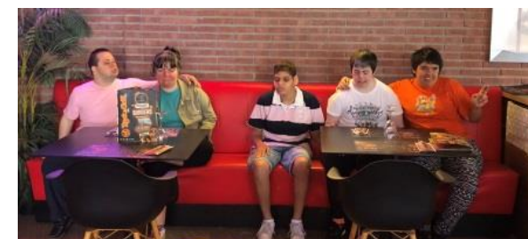
Gaudint a Salou!