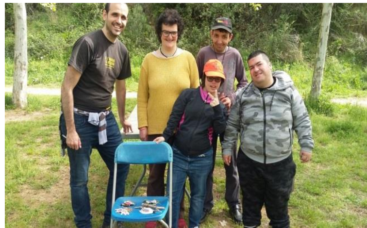
Els voluntaris de Prolaboral.

Hi vam anar alguns voluntaris de Prolaboral Xalest i ens guiava un voluntari de l'Adenc. Ens va ajudar a organitzar el nostre joc però n'hi havia molts més. El nostre era d'amagar els insectes en el seu hàbitat i els assistents tenien que trobar a on estaven amagats. Vam passar un bon dia!