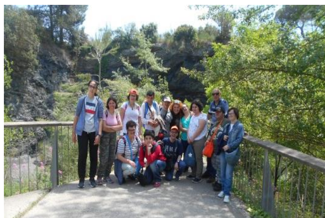
Gaudint a les vinyes.