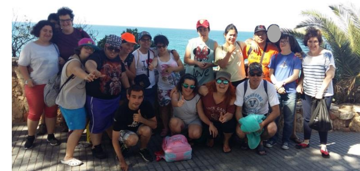
Entre el sol i els pirates!