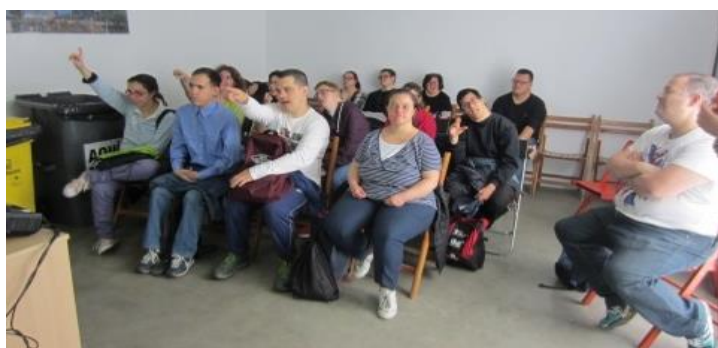
Aprenent sobre el reciclatge.