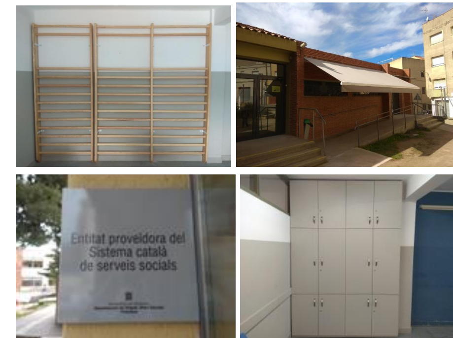
Les novetats del taller.

I per acabar una placa que ens identifica com a Entitat proveïdora del Sistema Català de Serveis Socials!