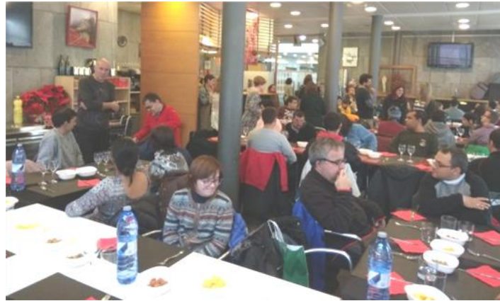
Tots junts al restaurant.

Aquest dia ens motiva perquè indica que s'acosten les festes de Nadal i ho celebrem fent un suculent dinar.