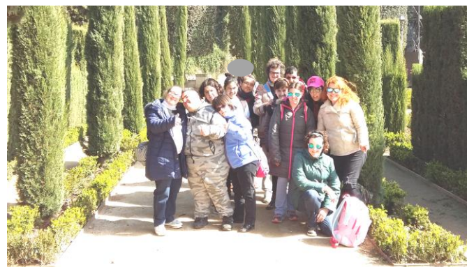
Fent pinya al museu i als jardins.