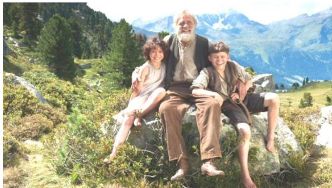
Davant del cinema i una imatge de Heidi

Al mes de gener el grup A vam anar al cinema Imperial de Sabadell a veure la pel·lícula "Heidi". Aquesta versió de Heidi no era de dibuixos animats sinó amb persones; vam trobar molt a faltar que no sortissin a la pel·lícula en "Pichí" i en "Niebla".