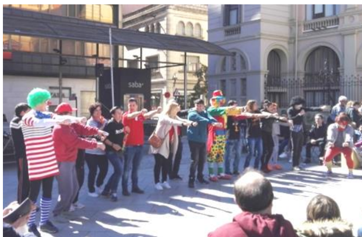
Participant amb els clowns!

Ja és el 8è any que ens reservem un diumenge al matí per celebrar la festa de l'entitat. Hi va haver varies activitats: una classe de zumba per ballar, una xocolatada, un espectacle de pallassos... i mentre això passava es podia visitar la nostra paradeta o el punt d'informació i passar pels tallers de maquillatge i dibuix. Després va actuar la nostra Coral Xalest i finalitzaven amb la tradicional rifa.