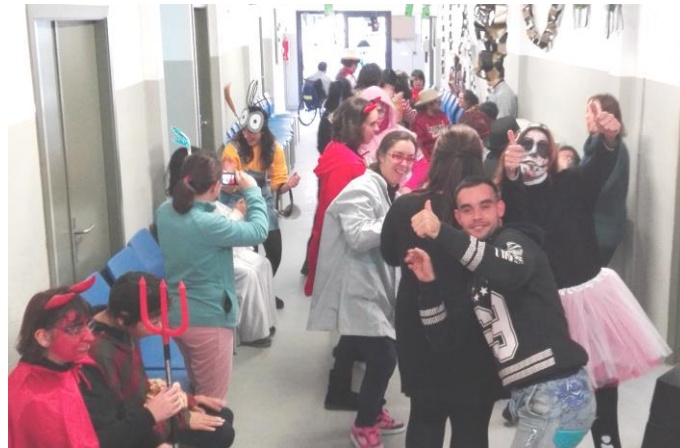
Movent el cos amb ritme.

Aprofitem la desfilada per treure les disfresses a passejar i el jurat decideix quin diploma ens enduem. Un cop acabada la desfilada cadascú a ballar amb la seva disfressa i fer una mica de gresca!