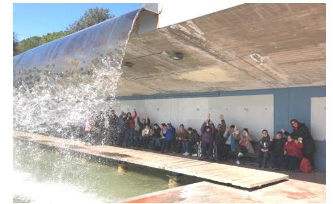
Passant-ho bé al Parc Catalunya.