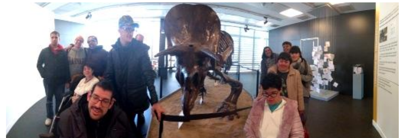
El nou membre honorífic del grup de serveis.

Per acabar ens hem fet fotos amb el triceratop que tant ens ha agradat i hem acabat la sortida dinant en un restaurant xinès.