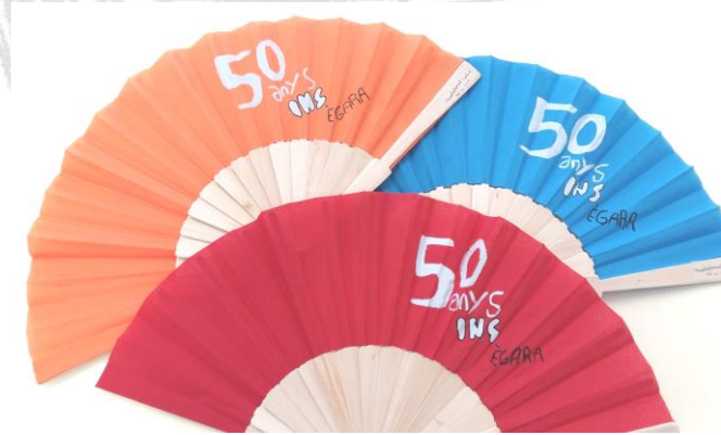
Els ventalls personalitzats.

L'institut Egara de Terrassa ha fet 50 anys de vida i per aquest motiu ens va demanar els detalls que es van lliurar a cada assistent al sopar d'aniversari. Amb molta delicadesa i dedicació vam personalitzar a mà cadascun del ventalls, que van tenir una gran acollida i van ser protagonistes de la nit.