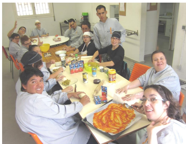
Els nostres cuiners!

Quan hem de fer un càtering, pels aniversaris i altres esdeveniments del taller, com per exemple el de l'Assemblea General tothom hi participa. El grup A fem pizzes, entrepans, cruixents de xocolata i preparam les begudes. El grup de treball col·laborem en la decoració (portatovallons). El grup de serveis fem els cartells informatius. Els grups B i C decorem les estovalles.