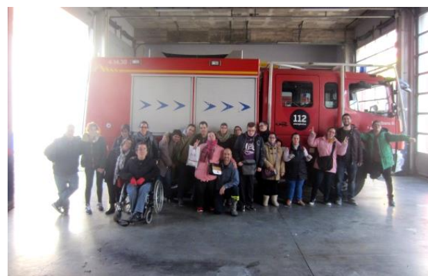
Bombers voluntaris per un dia.