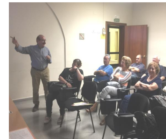
Els assistents a la xerrada.

Les xerrades s'han valorat molt positivament i esperem que a les properes hi participin més famílies.