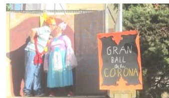
A dalt podem veure el cartell i a la dreta imatges del muntatge i els decorats rere la càmera.