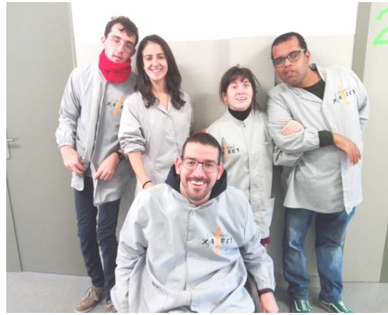
Els entrevistadors amb la Belén