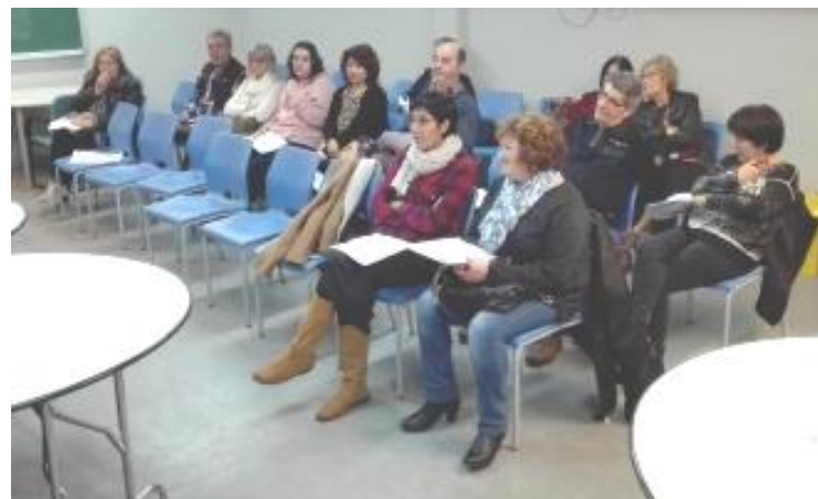
L'Assemblea General de l'Associació.