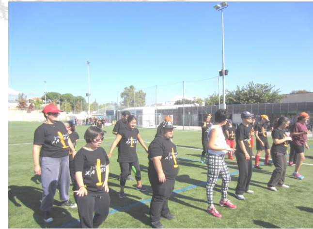
Movent el cos amb ritme.

Com ja és habitual que el taller gaudeixi d'un dia d'esport a l'aire lliure, el divendres 29 de setembre vam anar al camp de futbol d'Arraona-Merinals on es va esmorzar fort per començar les activitats. Vam gaudir fent zumba, jugant a futbol, fent jocs i softcombat.