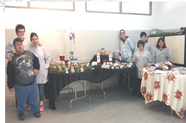
Els companys amb l'exposició.

Ja arriba el Nadal i per primer any el taller presenta a totes les famílies el producte de Nadal que hem elaborat. L'exposició es fa el 24 de novembre a la sala polivalent.