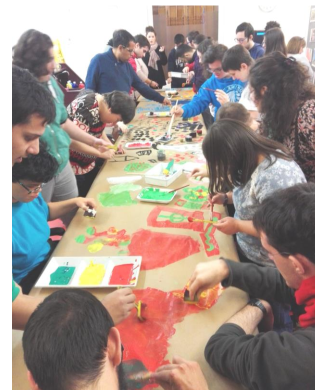
El mural feia goig!