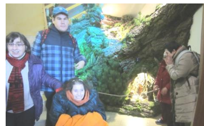
Encantats amb el que veïem!