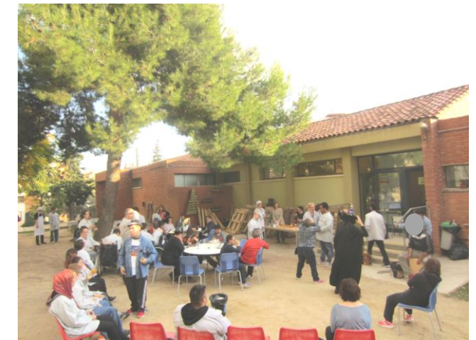
Gaudint de la festa.

Mentre ens les menjàvem vam gaudir d'un parell d'actuacions fetes pels grups B i C que van acabar d'arrodonir la tarda i ens ho vam passar molt bé.