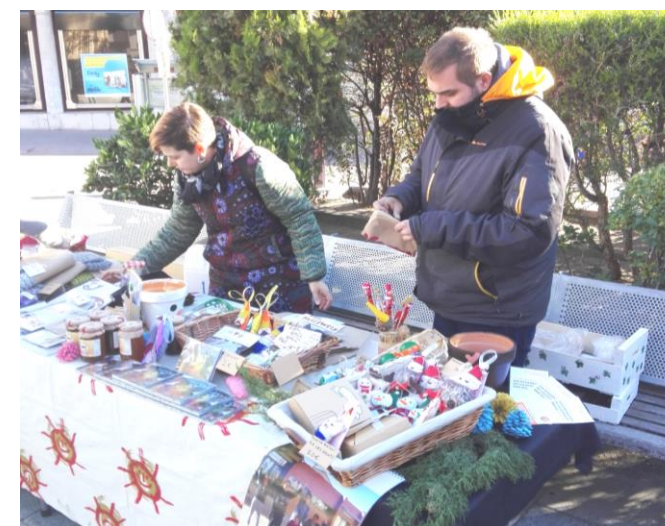
La paradeta al centre de Sabadell.

El 3 de desembre, amb motiu del Dia Internacional de la discapacitat, Protolaboral Xalest i altres entitats socials de Sabadell celebrem la Festa de les Capacitats a la plaça Doctor Robert.