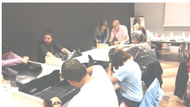
Companys i voluntaris plantant junts!

El divendres 20 d'octubre juntament amb la Fundació Adecco es va fer una jornada a l'Hotel Catalonia a la que vam participar els nois del grup de treball: primer vam anar a esmorzar a un bar proper i després a l'hotel a fer varis tallers: Hort, sabons i bijuteria.