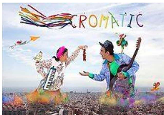
Imatge promocional de l'obra.

El dimecres 20 de març, els grups B i C, vàrem anar d'excursió a l'auditori de Sabadell on vam gaudir d'un espectacle musical, "Cromàtic". Al finalitzar l'espectacle, els músics van venir a saludar-nos i a parlar amb nosaltres una estona.