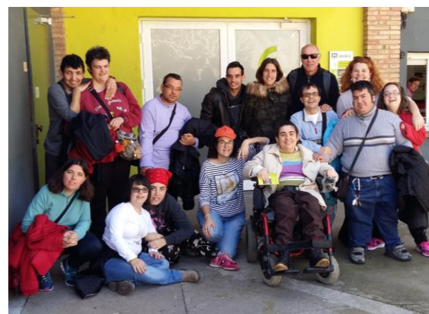
A les portes de CIPO

Després vam anar a dinar al bar-restaurant Uribe. Boníssim!!!!