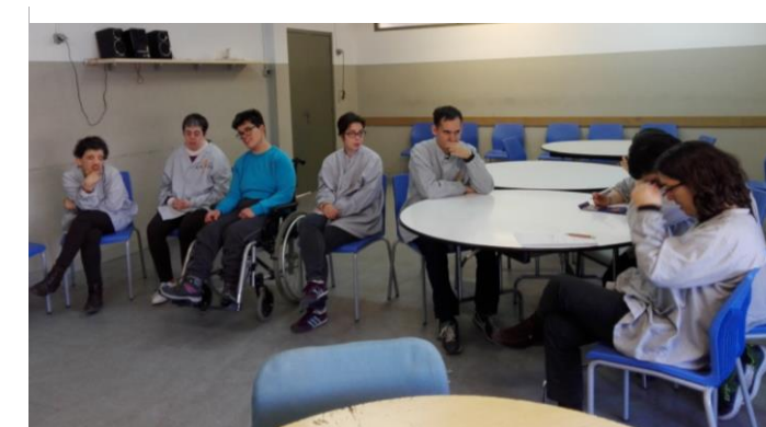
Membres de la comissió reunits

ha organitzat dues festes: Carnestoltes i la Festa a la Ciutat. Totes dues acollides amb molta satisfacció