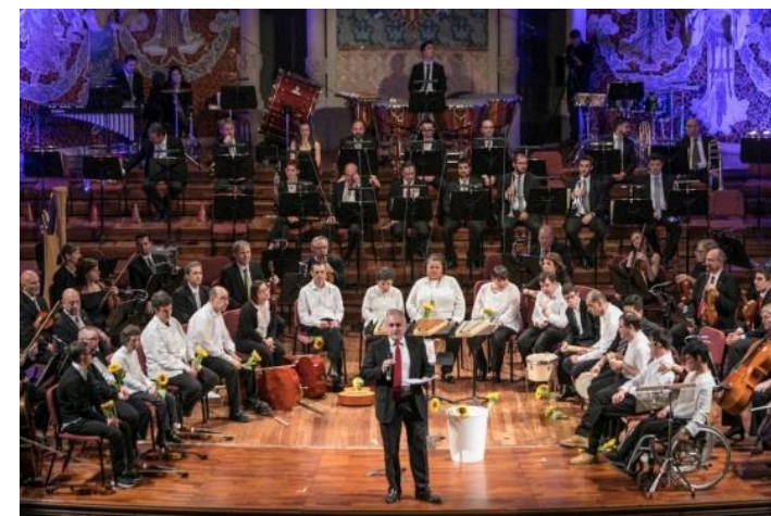
Al Palau de la Música Catalana.

El divendres 24 de març, a La Faràndula, els 17 participants del projecte Mosaico gaudim amb l'Orquestra Simfònica del Vallès de l'estrena del concert La flor mas grande del mundo , una meravellosa peça de José Saramago i Emilio Aragón.