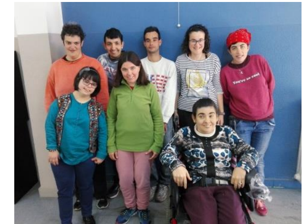
Els assistents a la xerrada.

Vam parlar de la relació de parella, respecte, intimitat, anticonceptius, amor... Vam fer preguntes i resoldre els nostres dubtes. Si voleu informació: www.sexejoves.gencat.cat