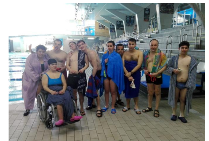
Dins les instal·lacions

Esperem seguir-hi venint molt de temps perquè ens encanta!!!