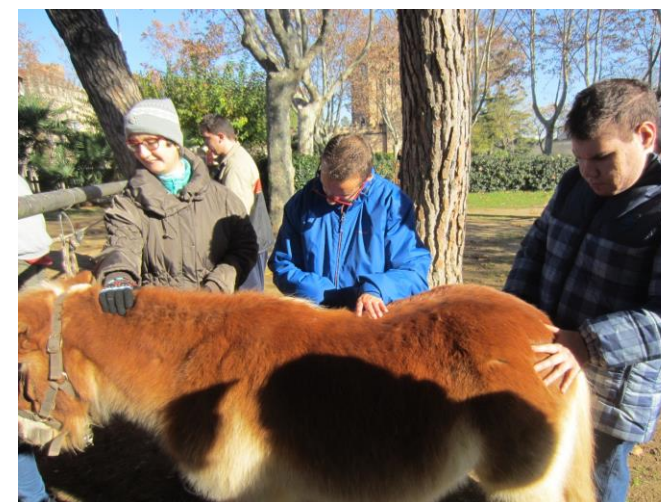
Raspallant el petit poni.

Sempre que anem a l'hípica ens ho passem súper bé!