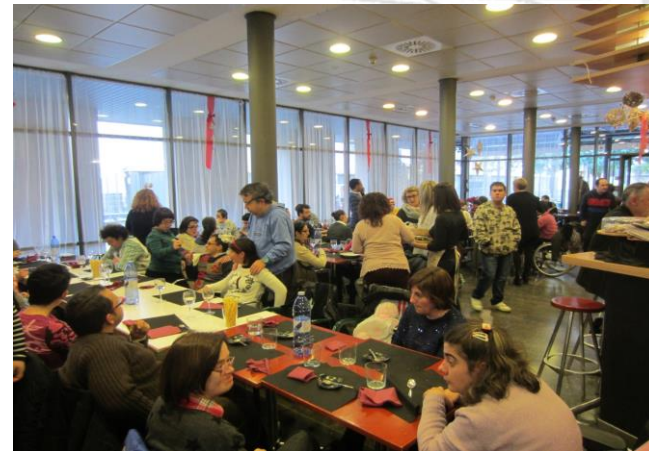
Gaudint de la companyia

De primer hi havia un púding de carbassó, de segon pastís de carn i de postres hi havia un avet de tres xocolates. Tot ho vam fer baixar ballant fins a final de festa on ens vam desitjar bones vacances.