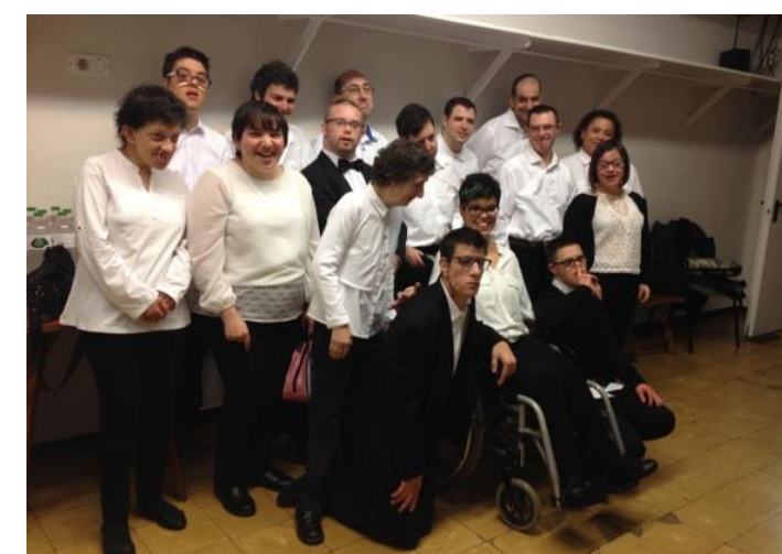
Els artistes entre bastidors.

La mateixa experiència la vam viure el dissabte 25 de març al Palau de la Música Catalana amb una acústica preciosa. Va ser espectacular!