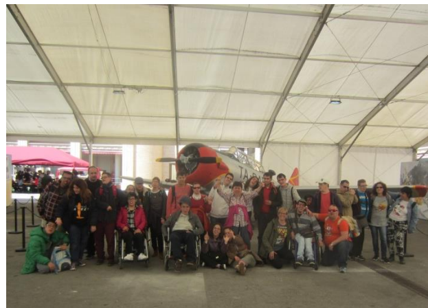
Cansats però contents!

El dijous 30 de març al matí els grups A i de Serveis vam anar al Saló del Còmic, que aquest any tenia com a tema els avions antics.