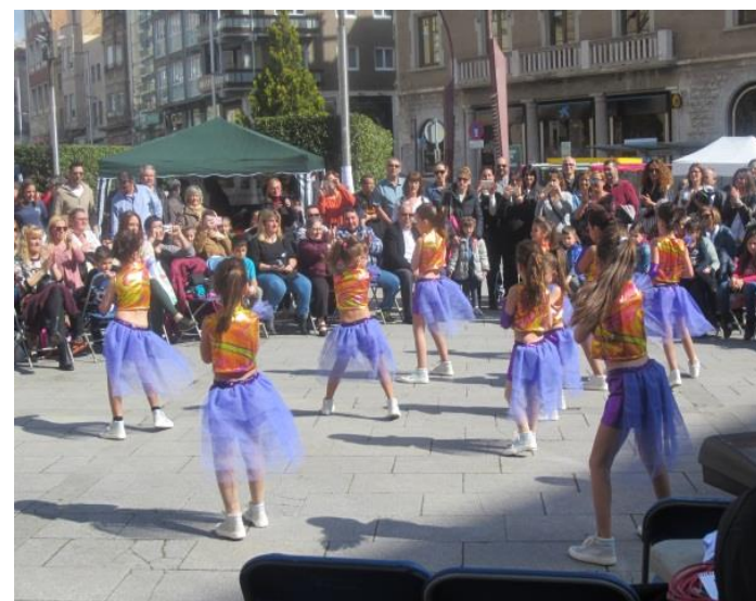
Un dels moments de l'exhibició de zumba.

El diumenge 26 de març vam celebrar la festa de Prolaboral Xalest on vam esmorzar xocolata i vam gaudir d'un dia radiant tot veient una exhibició de zumba i l'actuació de la Coral. Per altra banda també vam muntar un taller de pintar mandales, un altre de maquillatge. No va faltar la nostra paradeta que va lluir esplèndida amb els nous productes artesanals. Va ser un matí magnífic!!