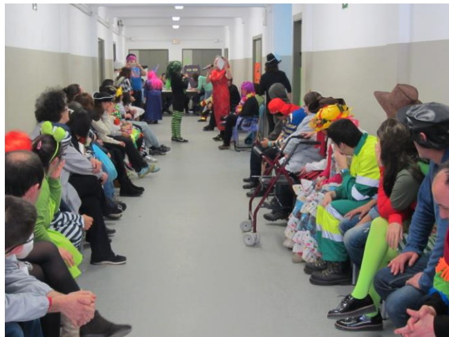
Expectants perquè comenci la desfilada

El passat dijous 23 de febrer a la tarda vam celebrar la desfilada de carnestoltes, on va haver disfresses molt divertides gràcies a la participació de molts companys. Cada disfressa anava ambientada amb la seva música i tots van rebre un diploma per haver participat.