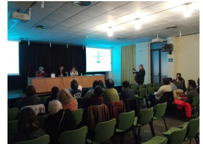
Presentant la xerrada.

Cal dir que costava quedar-se quiet aguantant postura i procurant mirar a la càmera. Al final hem quedat molt contents amb el resultat. Esperem que a tots vosaltres també us agradi!!