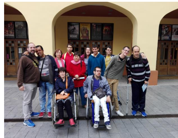
A les portes del cinema Imperial

Després vam anar a dinar a un xino i el menjar estava boníssim!!