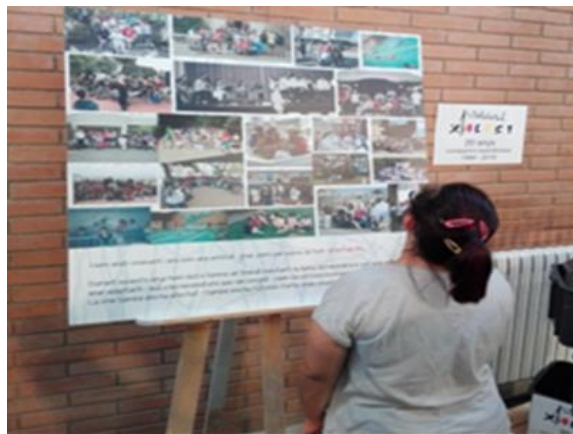
Diferents plafons de l'exposició

El passat 3 d'octubre vam inaugurar l'exposició fotogràfica "20 anys compartint experiències", creada pel Toni Fàbregas, al Centre Cívic de Can Rull.