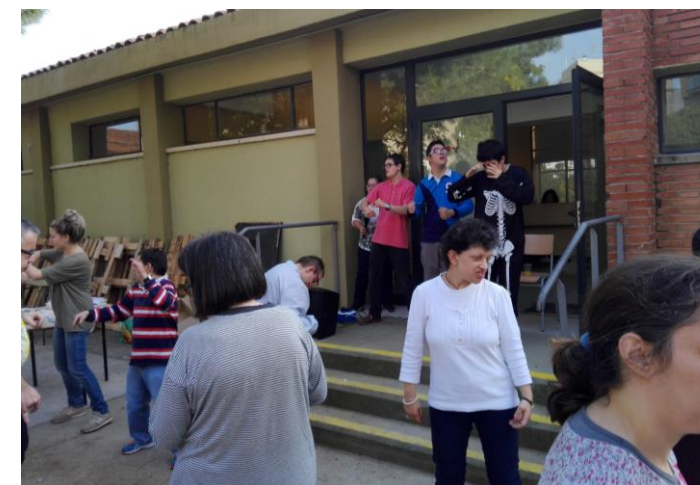
Ballant al so de la música

La festa va acabar amb molta emoció, bona música i molts aplaudiments. Fins l'any que ve!