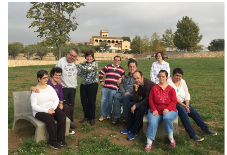
Els veterans del taller