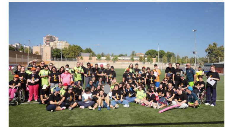
Cansats però contents!

Al cap d'una estona vam començar les activitats. Aquest any a més del zumba, futbol i jocs, hem provat el softcombat, que consistia en fer esgrima medieval amb espases de làtex. Tots ens ho vam passar molt bé!