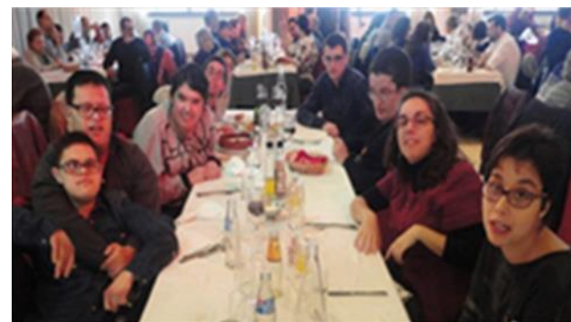
Gaudint de la companyia

Va ser un dia inoblidable. Esperem fer vint anys més!