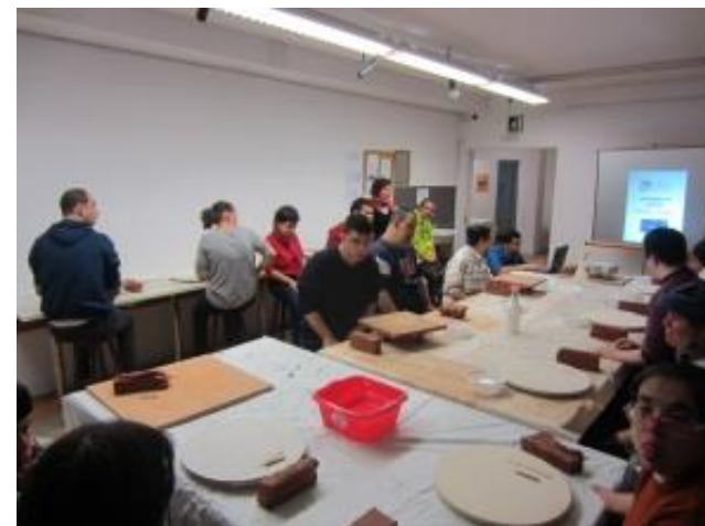
Els artistes a punt de començar a crear

El dimecres 9 de novembre, els grups B i C, vam visitar l'acadèmia de Belles Arts de Sabadell, on hem realitzat una activitat: modelar el fang per expressar la nostra creativitat. Un cop acabada la visita, vam anar a dinar al McDonalds