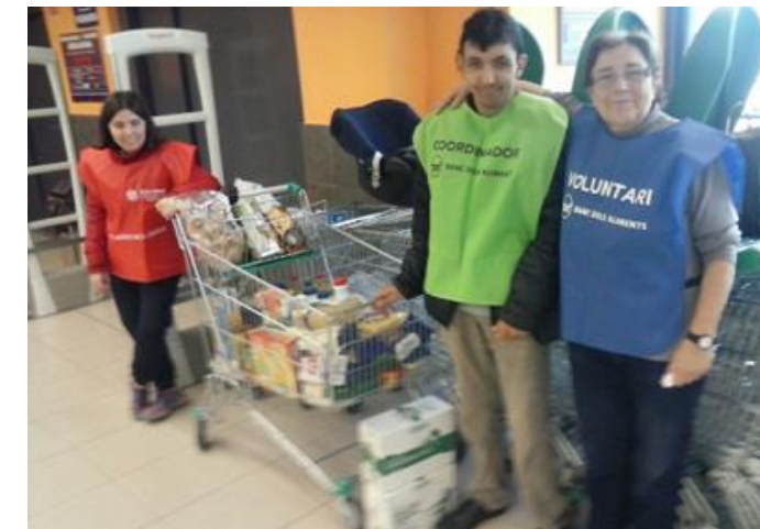
Alguns dels voluntaris del gran recapte