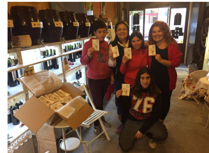
A la bodega Coca presentant el nou disseny

Dijous 15 de desembre vam anar a Barcelona per col·laborar amb la fundació ADECCO a unes jornades esportives juntament amb personal de l'empresa.