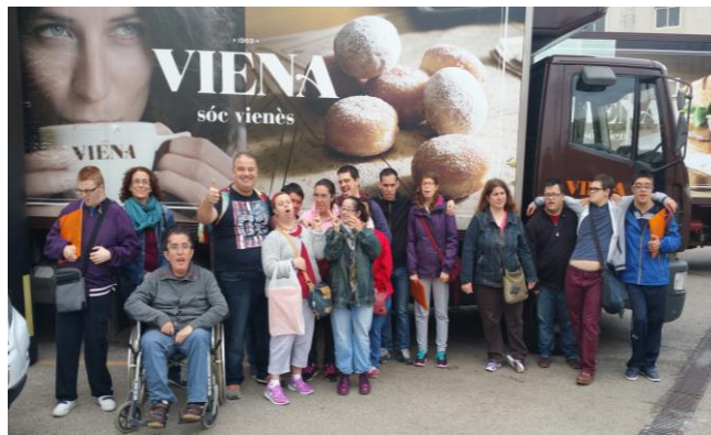
El grup A al sortir de la fàbrica

El 17 d'octubre, el grup A vam visitar la fàbrica del Viena. A l'arribar ens van posar un vídeo. Després vàrem fer una visita per les instal·lacions on vam poder veure com feien el bacó i les salsitxes de Frankfurt. A l'acabar ens van donar, un entrepà, un suc i unes carpetes amb informació.