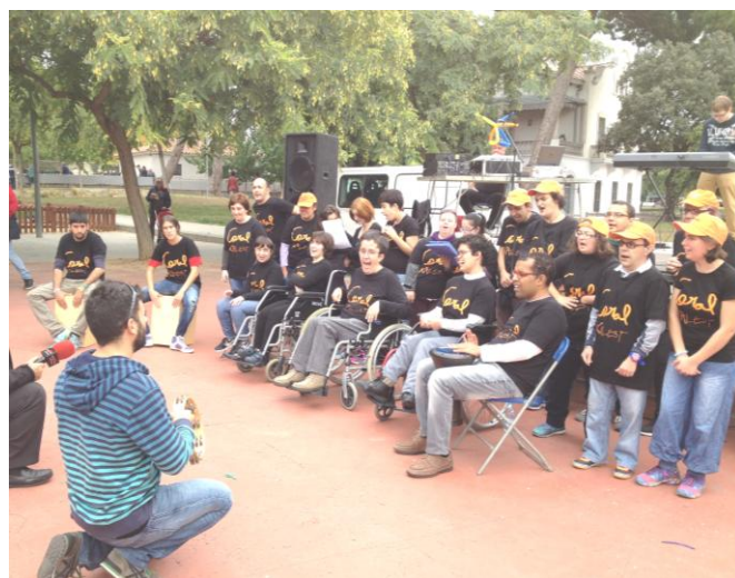
La coral en plena actuació

El passat 24 d'octubre vam celebrar la festa al barri, amb diverses paradetes, de diferents entitats, entre elles la nostra.