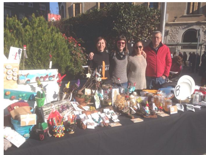
Xalest munta parada a la Festa