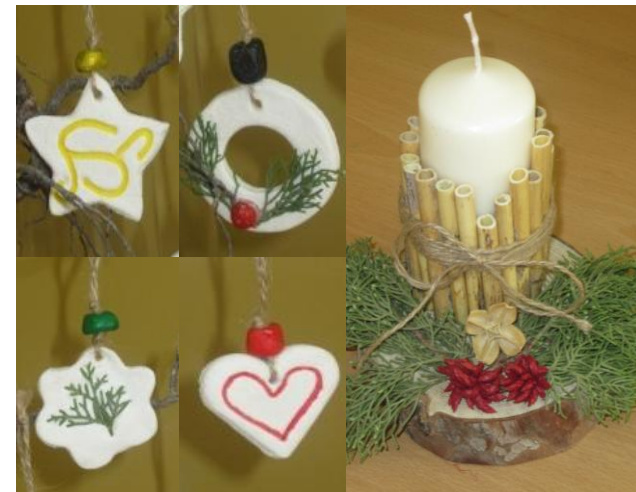
Detalls de Nadal