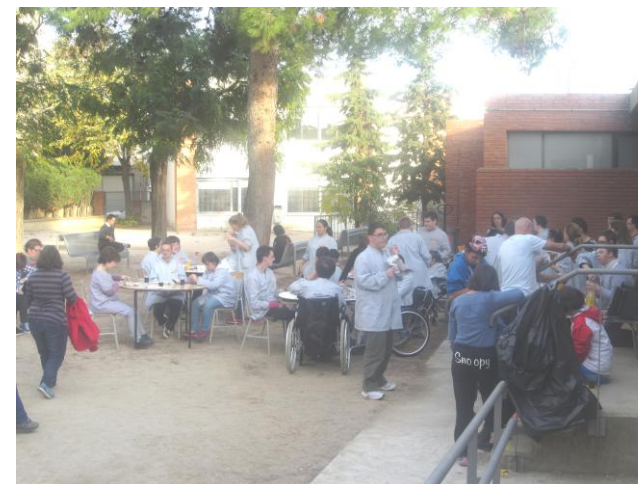
Gaudint de les castanyes i els moniatos

El dijous 29 d'octubre vam fer la castanyada.