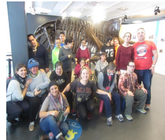
Davant del triceratops.