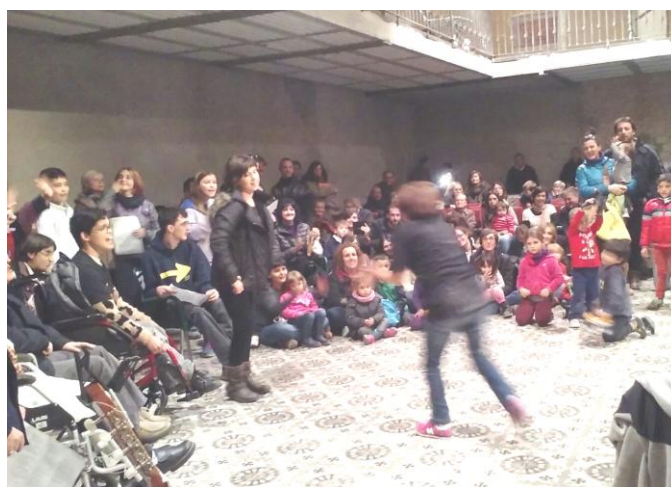
El clown en plena actuació

El divendres 4 de desembre a les 5 de la tarda vam anar a Sentmenat a cantar. Feia fred a l'Auditori perquè estaven reformant-lo. Hi havia un pallaso i un grup de percussió. Vam cantar el rabadà, fum fum fum, a quién le importa , entre d'altres.