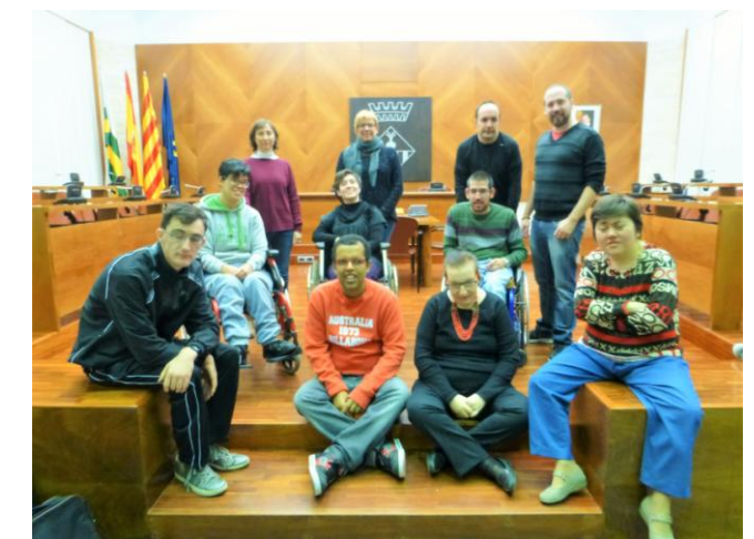
Les joves promeses de la política