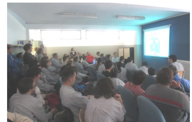
La projecció en marxa. Silenci...

Per acabar, vam celebrar la castanyada amb refrescos, moniatos, castanyes i ball!