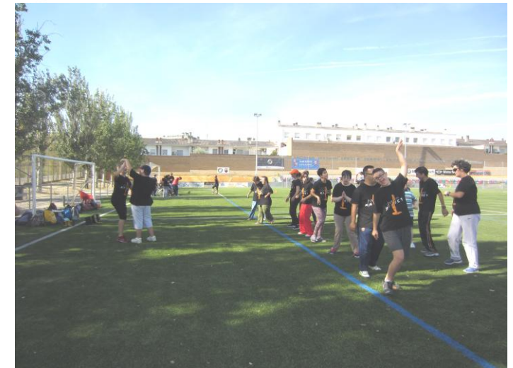
Movent el cos a ritme de zumba

Quan vam acabar alguns companys es van dutxar i uns altres van decidir fer-ho a casa, seguidament vam tornar tots cap el taller. Va ser un dia molt divertit!