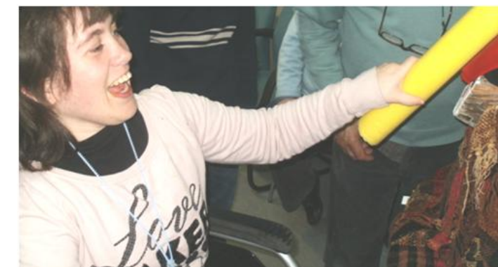
Fent cagar el Tió.

Ho vam passar molt be i esperem ser encara mes assistents l'any que ve. Així que ja sabeu, esteu tots convidats!