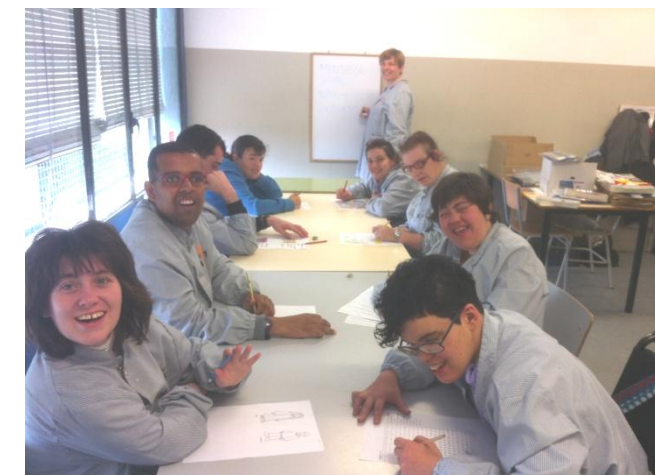
Treballant a la secció.