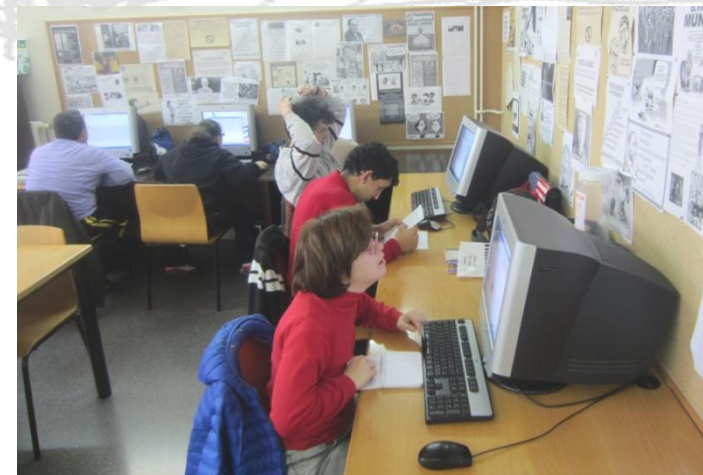
Al punt Òmnia del centre cívic.