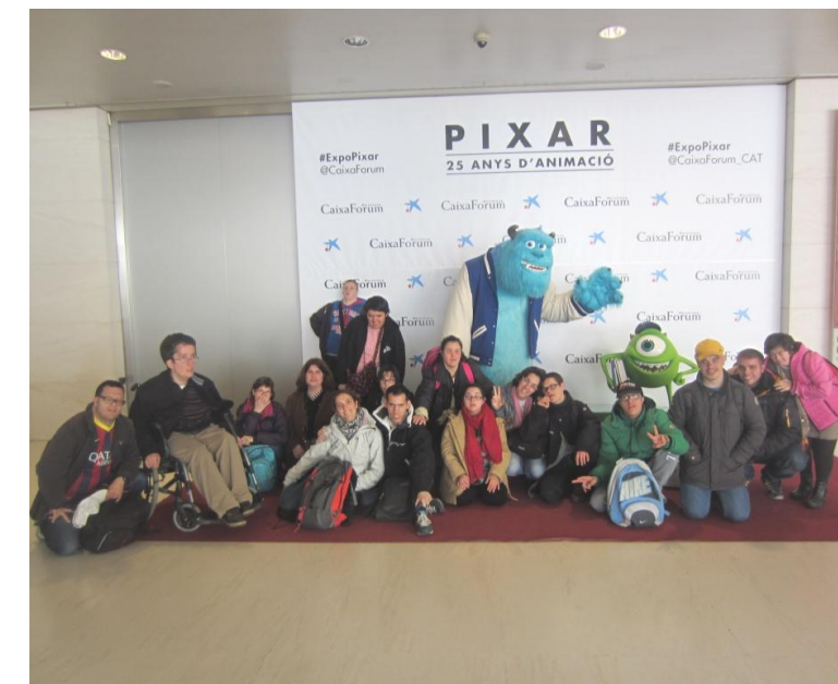
Davant el photocall de Pixar