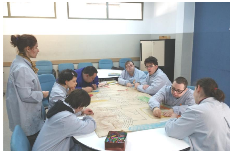
Fent el mural de la granja.

I el tercer treballaran tant l'estètica com la higiene.