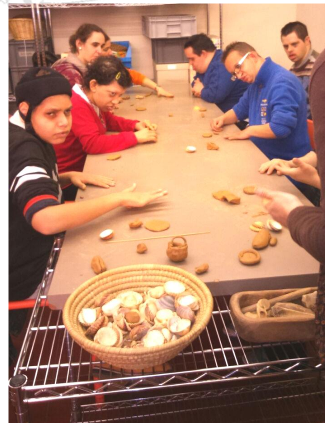
Els nostres artistes de la ceràmica.