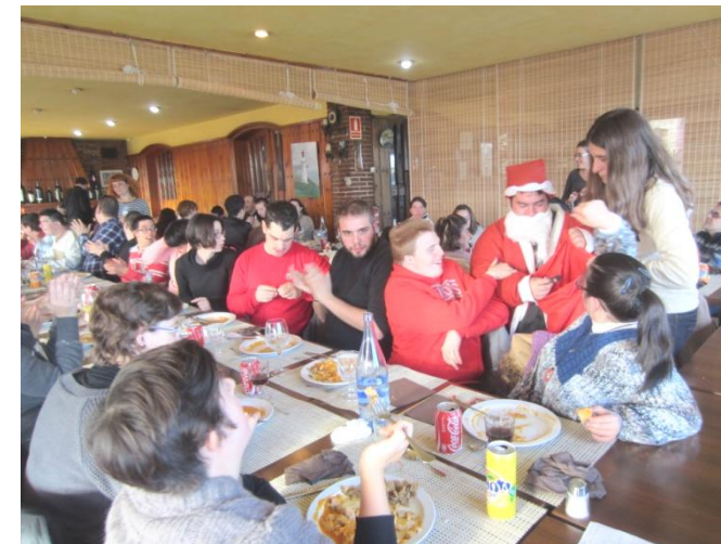
Ens visita el Pare Noel.