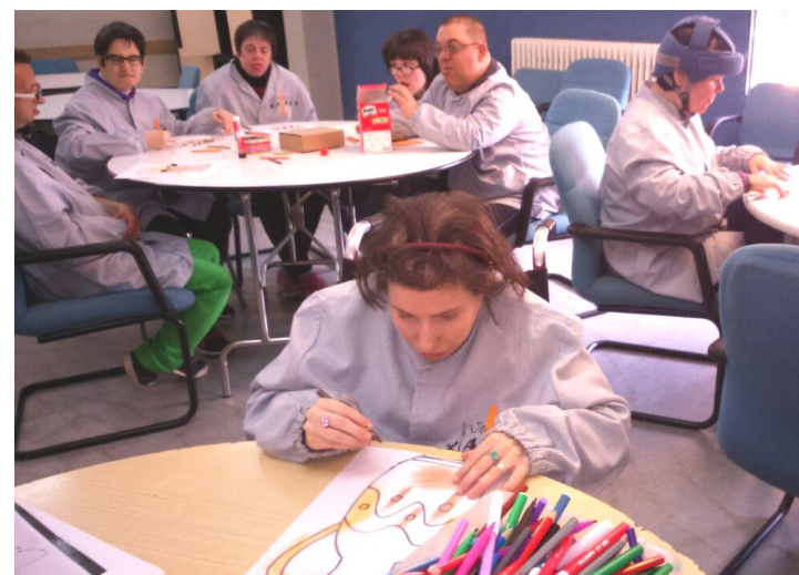
Anticipant la sortida del 2n trimestre.

Cada dimarts treballen diferents temes a mes de preparar les sortides: