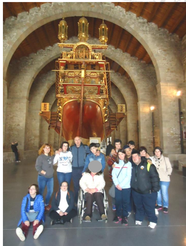
Davant la Galera Reial.