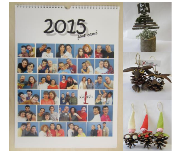
El calendari i el producte artesanal.

Amb el lema "X Un nAdAL eSpecial" el taller ens ofereix diferents productes tant per decorar les nostres llars i com per fer regals a les persones que estimem: el calendari amb fotos de les sortides del curs passat, la planta de Nadal decorada amb el nostre "toc personal" i el producte artesanal, creacions del grup de treball plenes d'emotivitat, esperit nadalenc i fetes amb productes de la natura.