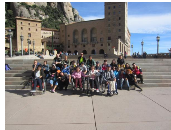
A la plaça del Monestir.