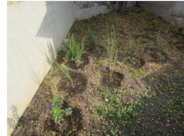
Algunes de les noves plantes.

A banda continuen fent planter i posant-lo al costat de la rampa i a sota dels xiprers per posar ben maco el pati. Els nostres jardineros convertiran el taller en un paradís!