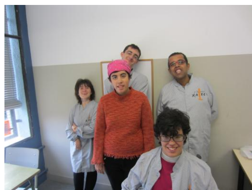
La Cristina i els seus entrevistadors

Anar al riu, on tallem canyes i reguem els arbres que hem plantat.