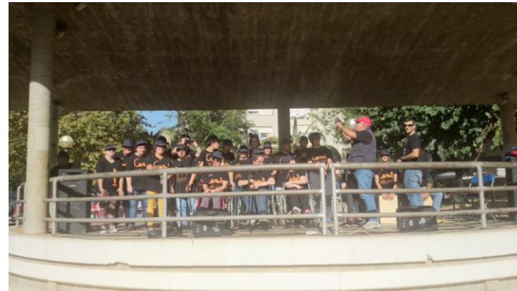
La Coral a l'escenari.

També vam poder fer tot d'activitats: entrevistes a radio Can Deu, muntar en poni, pujar als inflables si aportaves al rebost solidari, gaudir amb les actuacions de pàllassos, música... i cal destacar la participació de la Coral Xalest!