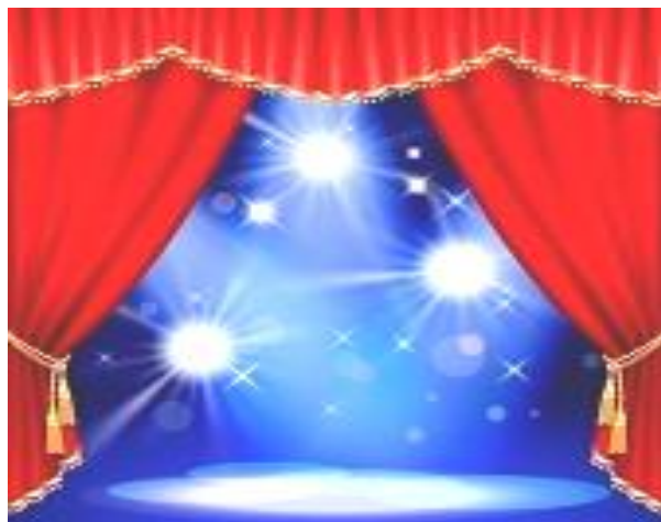
Esperem amb ànsies el dia de l'estrena!