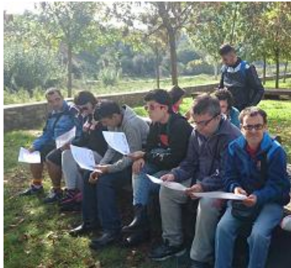
Treballant i aprenent al riu.