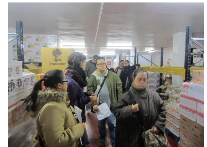
Al magatzem del Rebost Solidari