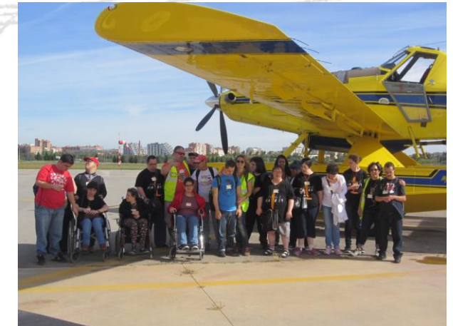
Davant l'avioneta a la qual van pujar després.