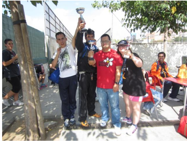
Aixecant els trofeus.

Com ja es habitual al setembre vam celebrar la nostra matinal esportiva al camp de futbol Rómulo Tronchoni. Els companys es van dividir en dos grups: Un va jugar a jocs molt divertits i balls ben moguts, l'altre grup van enfrontar-se en un partit amistós de futbol.