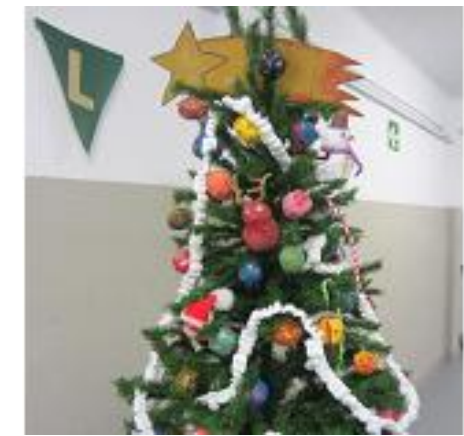
El nostre arbre lluint decoració.