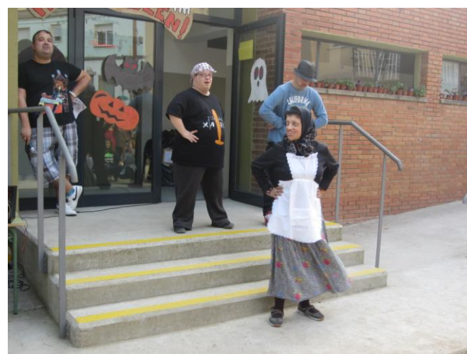
Cantant i ballant "La Castanyera"

L'endemà el grup de treball va posar la parada i vendre moltes castanyes.