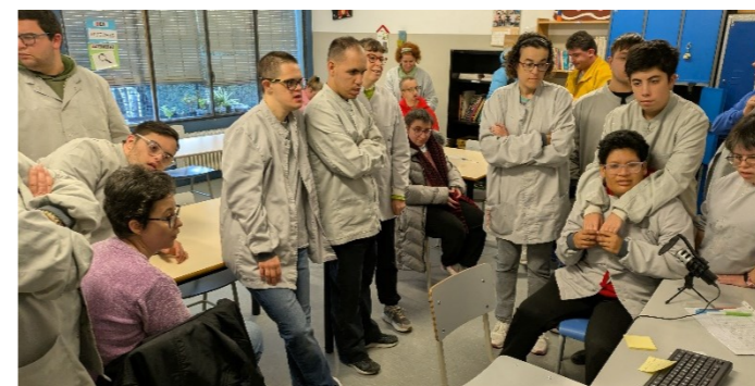
Entre tots generem contingut!

Aquest curs comencem a fer, un dia a la setmana, la ràdio amb tot el taller. Cada dijous, per grups, gravem un programa per enviar a les famílies. La ràdio és un projecte que vam iniciar al grup 1 i que al veure que agrada tant, l'hem volgut fer tots.