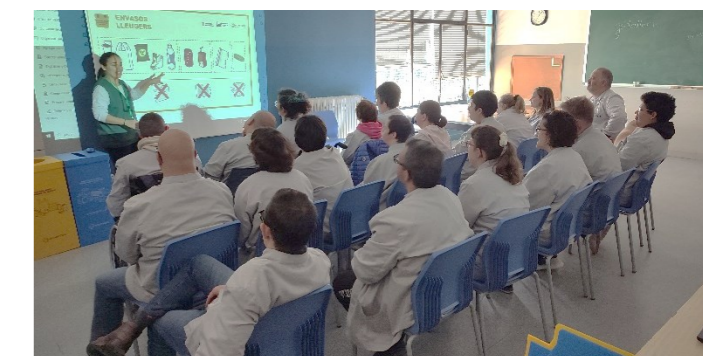
Per un planeta més net!

Dimecres 4 de desembre, els grups 3, 4, i 6 rebem una formació de l'empresa de reciclatge ECOEMBES. Aprenem noves formes de reciclar de manera eficient i a conscienciar-nos de la importància de fer-ho. Volem un planeta net i des del taller posem fil a l'agulla!!!