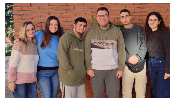
Benvinguts i Benvingudes a la família!!