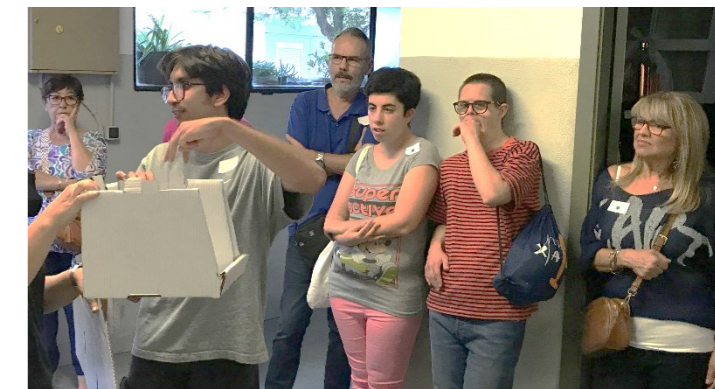
Explicació d'una de les activitats.

Dijous 26 de setembre, les famílies coneixen de la mà dels seus fills i filles les diferents activitats que fan al taller. En dos torns, passen per les diferents estàncies de les instal·lacions. A l'acabar, ens reunim al pati per compartir un pica-pica molt bo elaborat pel nostre servei de cafeteria.