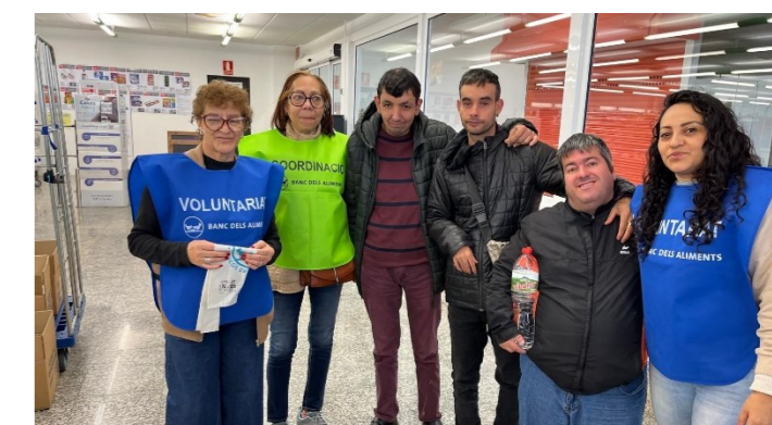
Els col·laboradors fent pinya al Condís!

Divendres 22 de Novembre fem dos grups per col·laborar al Supermercat Condís i al BonArea. Recollim molts productes alimentaris i d'higiene per als damnificats per la Dana a València, i pel Rebost Solidari. Des del Centre Ocupacional sempre estem disposats a ajudar!