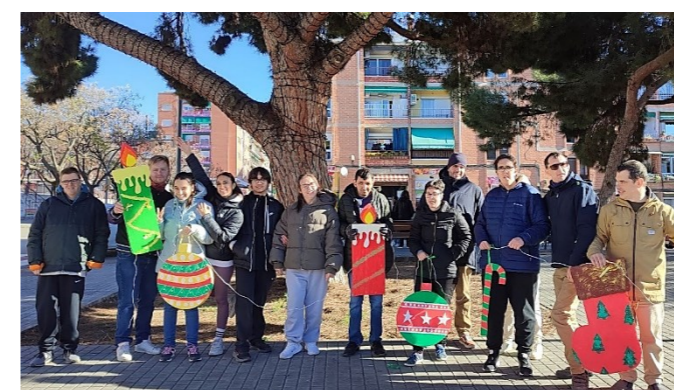
Decorem l'arbre del barri!

Com és tradició cada any participem en la decoració nadalenca de l'arbre de Can Rull. Aquesta vegada ho fem amb figures de porexpan. Les retallem i pintem i anem a portar-les cap al centre cívic per ajudar a decorar.