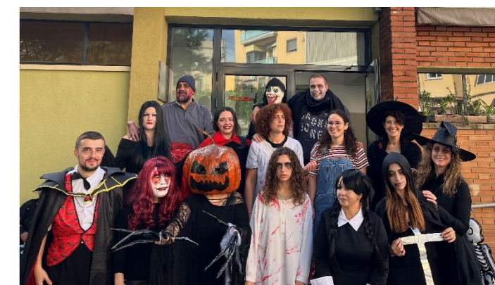
Ensurts, castanyes i festa! Visca el castahalloween!!

Molta música esfereïdora, increïbles disfresses, pors i riures. Acabem amb un gran ball al pati.