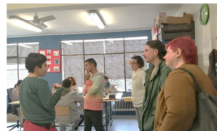
En un moment de la visita