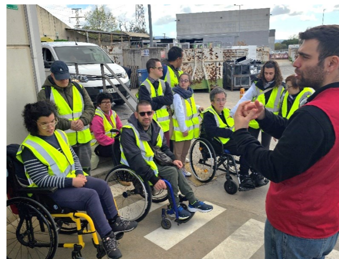
En un moment de la visita

Gràcies a aquesta visita hem pogut resoldre els nostres dubtes i ampliar els coneixements sobre aquest tema. Després de la visita hem anat a dinar a l'Escorial, un restaurant a prop del taller on ens han tractat molt bé.