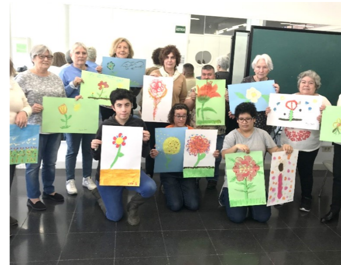
Amb les dones participants i les obres finals

Cadascuna pinta la flor que la representa i comparteix els records i les emocions que evoca cada flor, formant entre totes un jardí que després s'exposa al C.C. Can Rull i al Complex Alexandra.