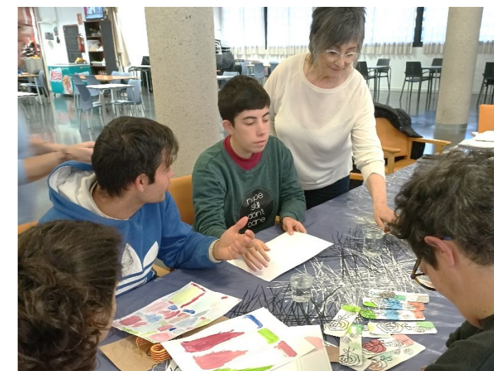
Ens agrada ensenyar allò que sabem fer!!