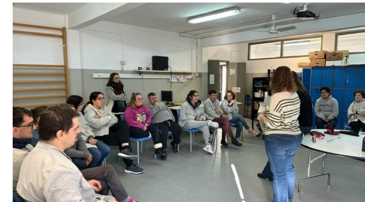
Descobrint i aprenent!

El 25 de gener assistim a la xerrada de Sexeafectivitat. Els hi preparam un full amb tots els dubtes que tenim i que volem parlar a la sessió. Les formadores, molt simpàtiques, ens expliquen tot molt clar, ens posen exemples i ens donen les explicacions amb imatges i objectes. Volem repetir!!