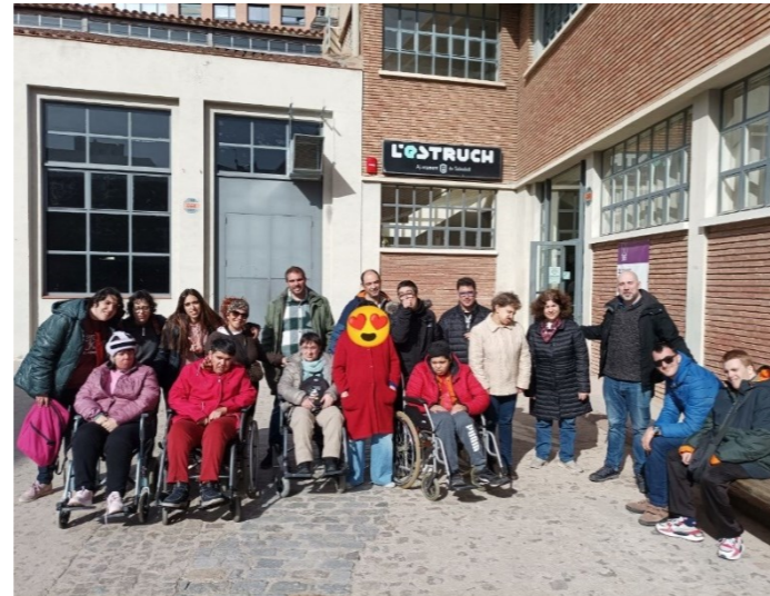
A l'entrada d'artistes!

Assistim a un assaig on fan equilibris, llançament de ganivets, faquirisme sobre vidres trencats i molt més!