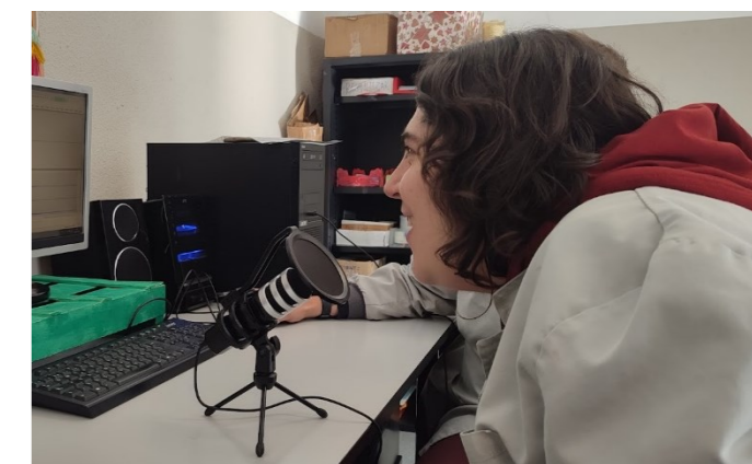
El g1 dedica un programa de radio especial al 8M

Per el 8M, dia de la dona, cada secció ha treballat de manera diferent; el G1 fem un programa de radio especial i el passem a la resta, el G2- G3-G4 i G5 treballen aquest dia amb videos sobre el paper de les dones. El G6 prepara un mural amb frases i cançons que penja al passadís .