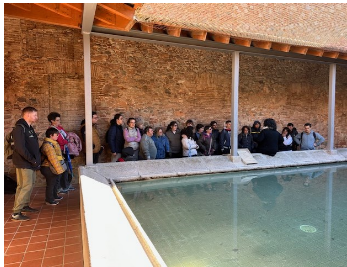
Aquí estem fent un bon safareig!!

Dilluns 11 de març els Grups 3 i 4 anem al Safareig de la Font Nova de Sabadell. Allà en expliquen que antigament la roba es rentava a mà i amb sabó també fet a mà! A l'acabar anem a veure diferents monuments de Sabadell com l'Església de Sant Fèlix, l'Hotel Suís, l'antiga Estació de Renfe... i aprofitem per fer moltes fotos. Finalment anem a dinar al restaurant Picanyol.