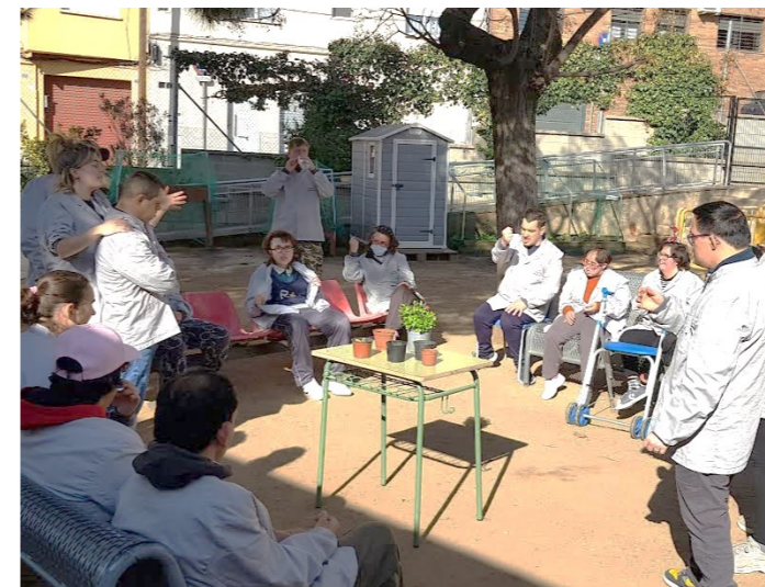
Ens omplim de bones olors!!!