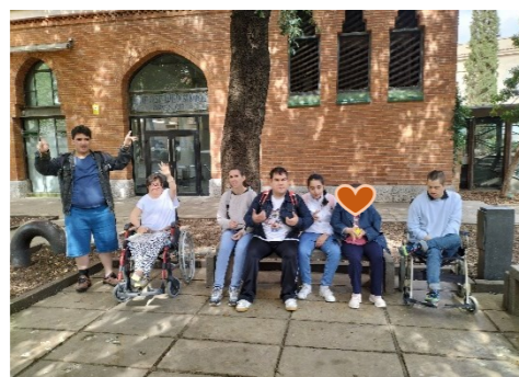
Dimecres 10 de maig. El G2 al sortir del Museu d'Art.