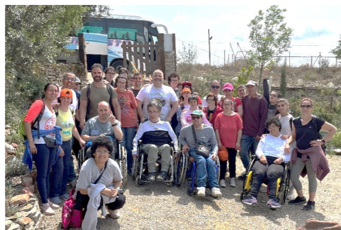
Fem una foto de grup abans de marxar!!

Dinem allà i veiem els animals de la granja del costat. Està molt ben muntat!!!