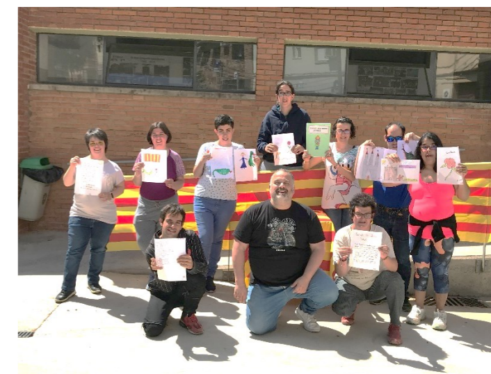
Mostrem els nostres escrits als companys

Aquesta jornada cultural ens enriqueix molt.