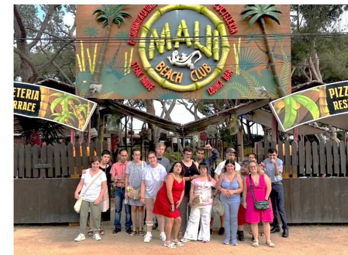
Anem a prendre uns còctels!!