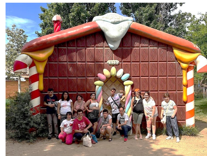
Davant la casa de xocolata al parc Francesc Macià

L'últim dia, comprem records i prenem un gelat per acomiadar-nos d'aquests dies de vacances. Per fi tornem a anar de viatge!!