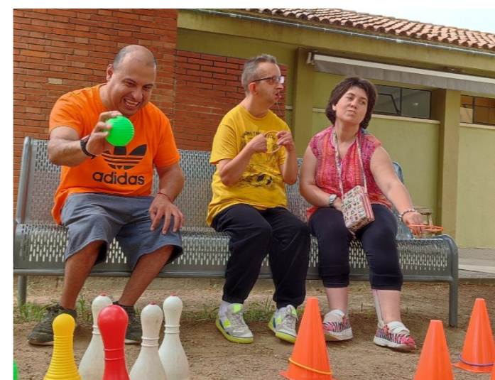
Aprofitem les hores de menys calor per les activitats!

Aquest juliol la temperatura comença a enfilar-se. Ja tenim aquí l'estiu!