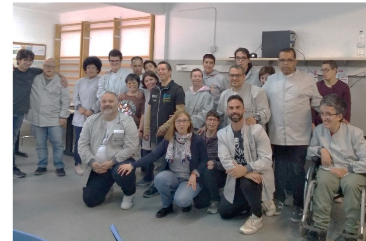
L'Arnau amb els participants a la xerrada

Ens parla també de la importància d'utilitzar el contenidor vermell que tenim al pati del taller per reciclar correctament l'oli i així ajudar a cuidar el nostre planeta.