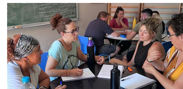
En diferents moments de la formació