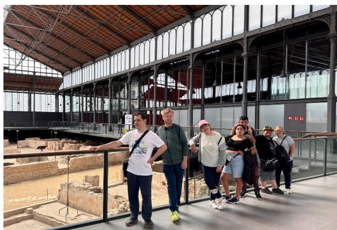
En un moment de l'activitat!!

Dimarts 30 de maig el G4 anem a passar el dia a Barcelona, a visitar el barri del Born i fer una activitat al Centre de Cultura i Memòria del Born. Per dinar anem a un restaurant Xinès de la zona i mengem molt bé. A l'acabar, comprem records i fem turisme.