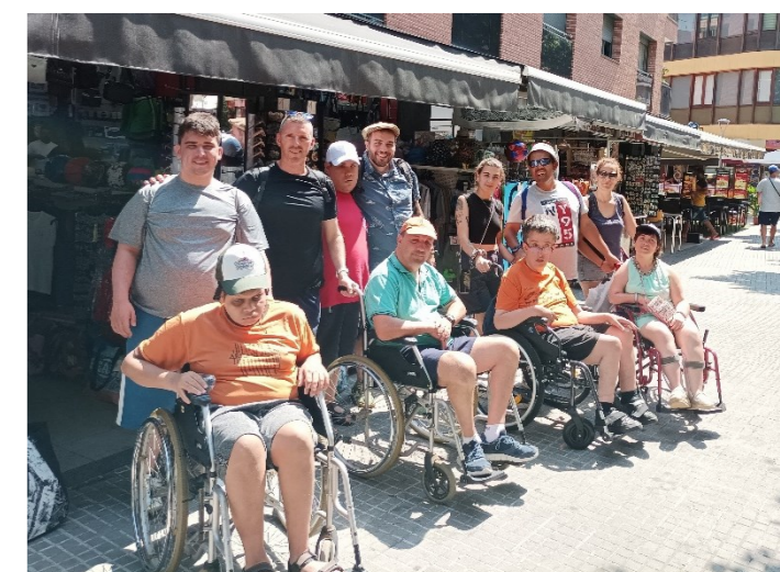
De passeig per les botigues

La nostra preferida es la nit de gala, on ens amenitzen la festa amb un dj molt enrotllat! Que bé ens ho passem!!