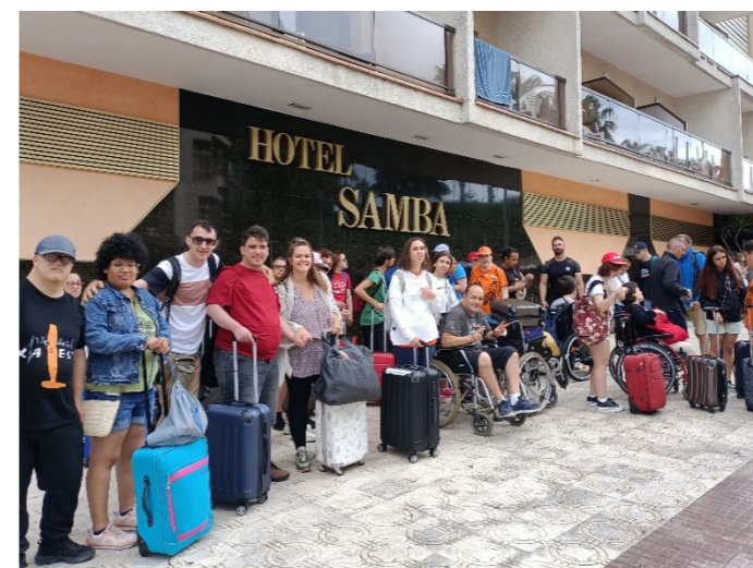
Tot el grup davant l'hotel

Allà ens atenen molt bé i gaudim de les nostres activitats preferides: anem a la piscina, descansam i gaudim del bufet lliure.