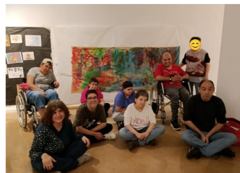
Dimarts 23 de maig. El G5 mostra el seu mural