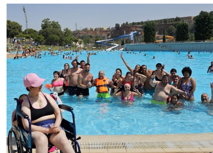
Refrescant-nos a la piscina!!