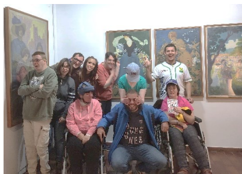
Dimecres 19 d'abril. El G1 davant d'algunes obres.

Al mes d'abril i maig el Grup 1, Grup 2 i Grup 5 realitzem una activitat al Museu d'Art de Sabadell. Després de les explicacions del guia sobre l'art actual, cada grup pinta un mural escollint els colors i l'eina que mes els hi agrada. Els companys que participen al projecte "Mirar l'Art amb altres ulls" expliquen la seva obra escollida.