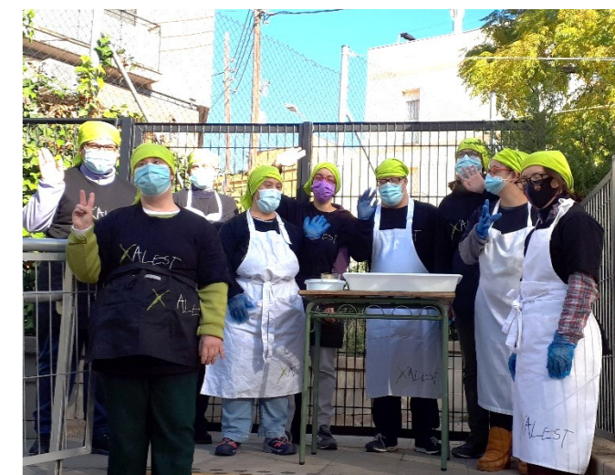
L'equip de cafeteria amb uniformes nous.

També estrenem uniformes. Tornem-hi amb ganes i il·lusió!