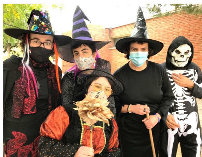
Unes disfresses de molta por!!