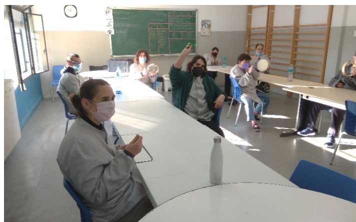
G6 Reconeixem sons i instruments