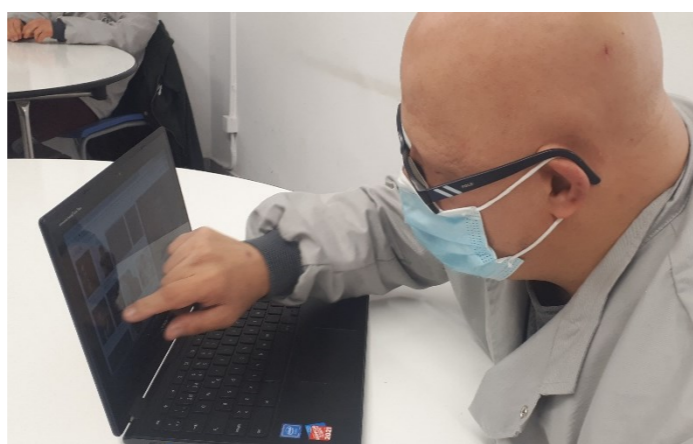
G7 Coneixem els actors i actrius actuals

Després de tantes restriccions de mobilitat necessitem bellugar el cos.