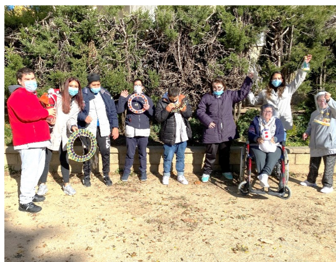
Quines decoracions més maques!!

Aquest any totes les seccions del taller col·laborem en la decoració de Nadal del barri de Can Rull.