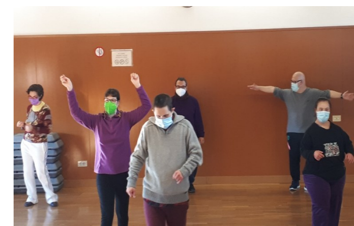
G7 Ballem i ens movem a Can Rull