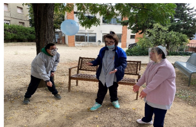
G2 Juguem i ens divertim en equip