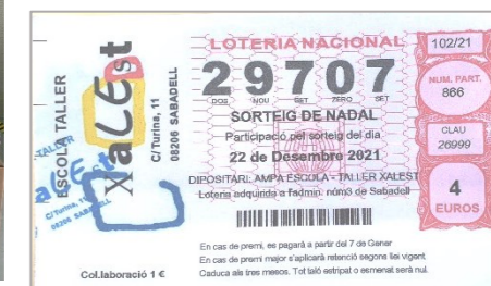
Aquí tenim el número de la sort!