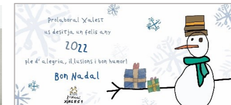
Bones festes a tothom!!!!