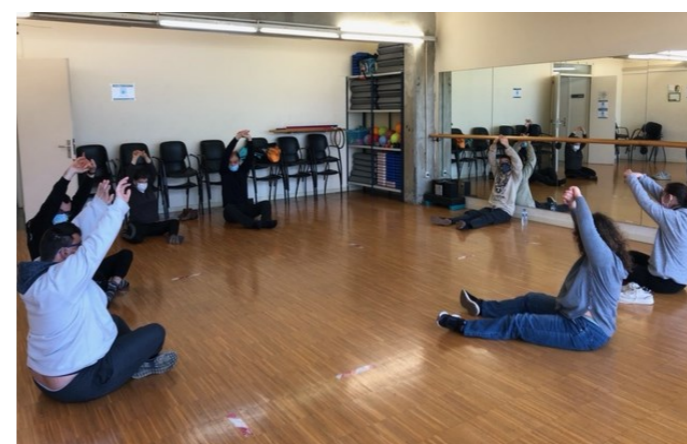
G6 Participem a l'activitat Belluga't