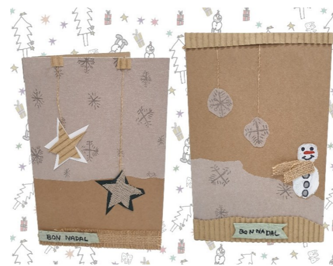
Les postals proposades per nadal

Per tercer any consecutiu rebem la comanda de postals de Nadal de l'Escola La Jota. Aquest any la comanda s'incrementa i fem 150 postals!!!