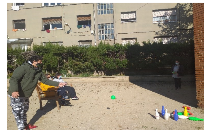
G5 Juguem a bitlles al pati del taller