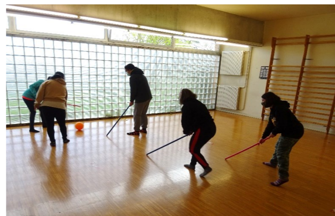
G4 Jocs esportius als Merinals