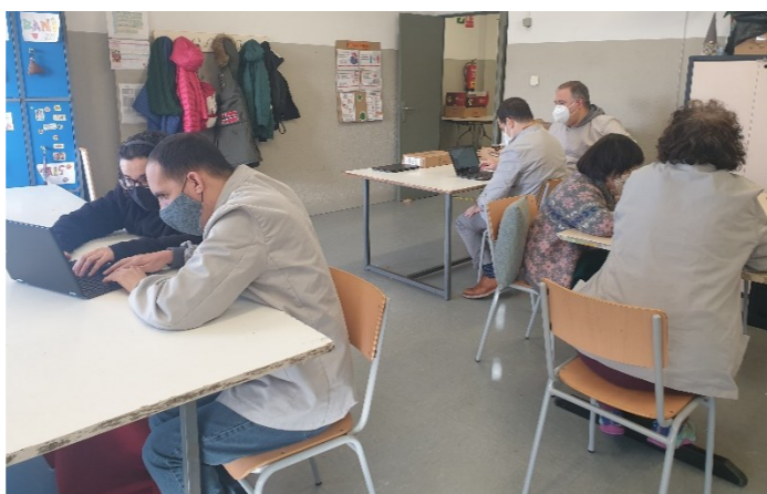
G3 Fem recerca dels rius de Catalunya