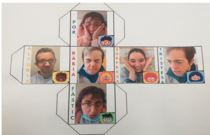
G5 Fem un joc de les emocions