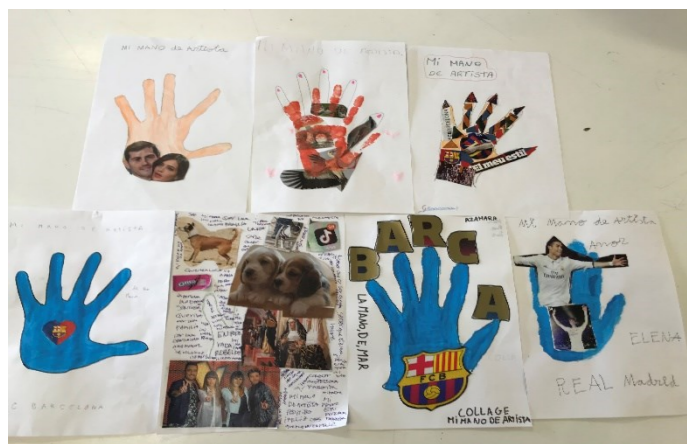
G4 Ens expressem a partir de l'art