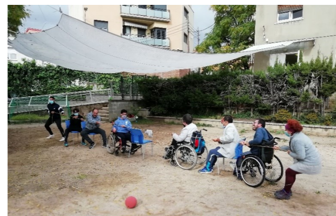
G1 Fem estiraments a l'aire lliure

Enguany fem dos sessions d'activitat física a la setmana. L'exercici és un hàbit saludable que ens ajuda a estar en bona forma física i mental. A més alguns grups tornem al gimnàs dels centres cívics!!