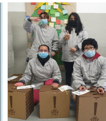
Quina emoció el lot de nadal!!