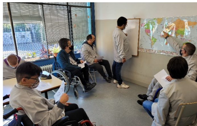
G1 Coneixem països interessants

Setmanalment, treballem el tema triat pel grup. Activem la ment mentre gaudim experimentant, recordant i actualitzant coneixements amb companys i companyes.