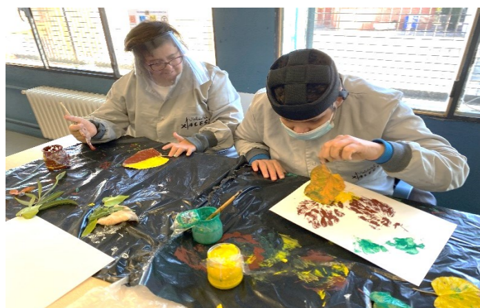
G2 Treballem amb colors i formes