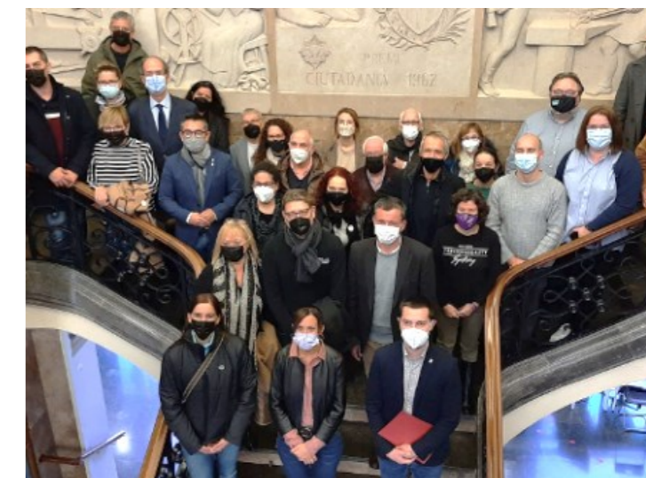
Els nostres representants a l'acte institucional.