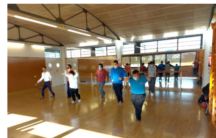
G3 Fem estiraments gaudint l'activitat