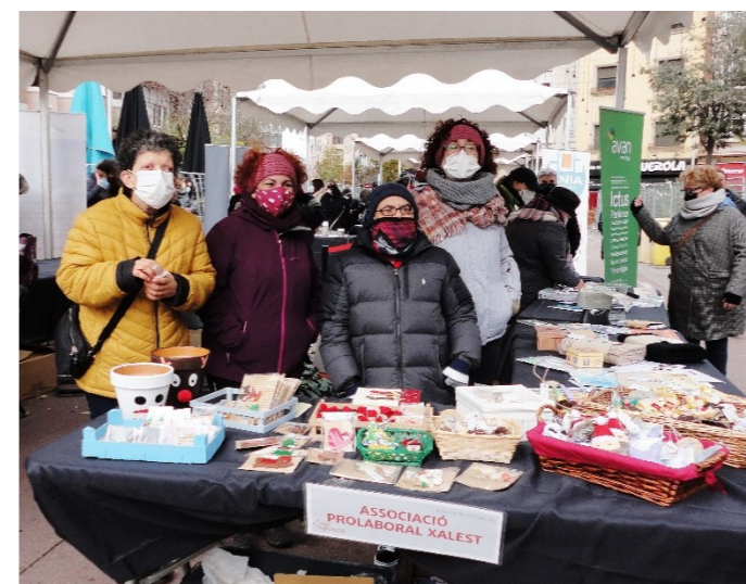
La paradeta amb uns ajudants de primera.

https://www.youtube.com/watch?v=qW534I8mAbQ